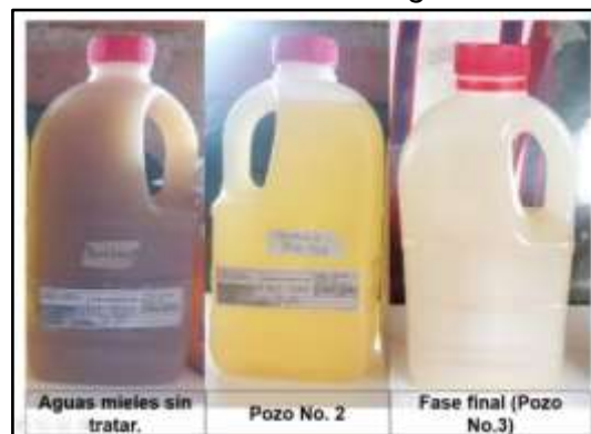
Figura No. 2. Análisis de las etapas del sistema de tratamiento de aguas mieles.

De acuerdo con los resultados obtenidos en cada análisis se evidencian porcentajes de remoción para la DBO de hasta un 93,4 % y para la DQO hasta un 94,24%, comprobando así la efectividad del sistema artesanal en los procesos de remoción de la carga contaminante, cabe anotar que la media para el pozo No. 2 para DBO fue del 58% y para el biofiltro del 80%, así mismo la media para DQO en el pozo No. 2 fue del 66% y para el biofiltro del 90%. Los resultados se pueden observar en la figura No. 2 que permite apreciar el cambio de color alcanzado a causa de la decantación y acción microbiológica del sistema, teniendo como referencia las aguas mieles sin tratar y las aguas resultantes al final del proceso.