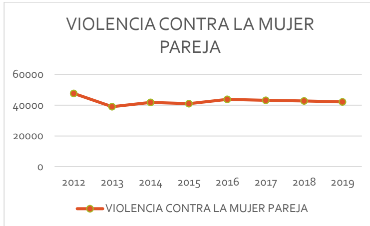
Gráfico 1. Casos de violencia contra la mujer pareja, Colombia, años 2012 - 2019