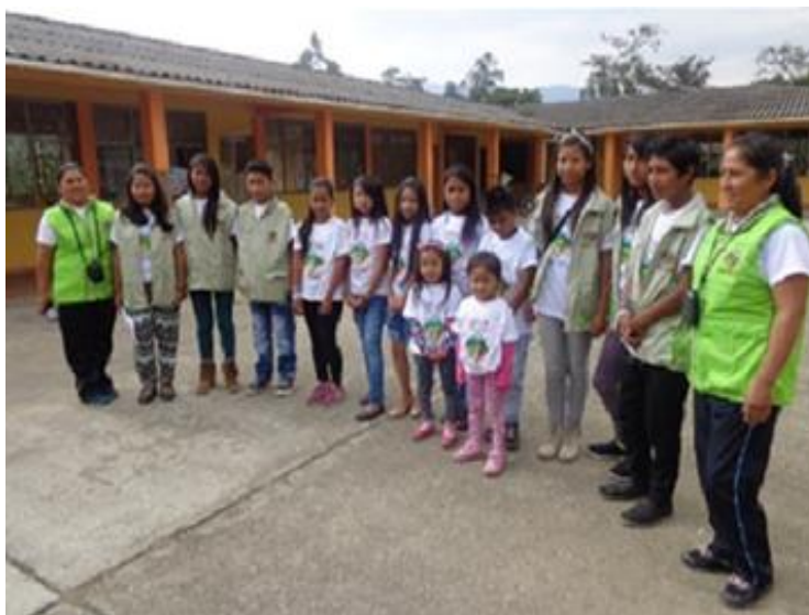
Gráfico No. 2 Estudiantes Institución Etnoeducativa Kamëntšá

Es importante señalar que desde la creación de la Institución, las Autoridades Indígenas, el cuerpo docente, los directivos de la Institución, los estudiantes y la comunidad educativa, no han podido materializar completamente los propósitos y la misión para el cual fue creada, específicamente en lo que tiene que ver con salvaguardar la identidad integral Kamëntšá.