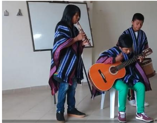
Grafico No. 13. Expresión Musical