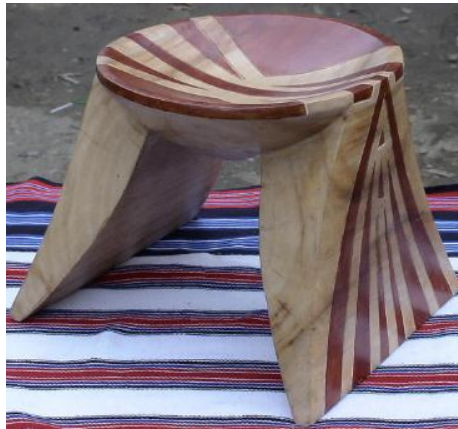
Grafico No. 8. Tshenesh; banco tradicional, símbolo del

3. JENEBTBIAMAN: “sembrar la semilla del diálogo”, es el encuentro para sentarse a dialogar, incluye la participación integral de la familia, de la comunidad donde niños, jóvenes, adultos y mayores dedican el tiempo necesario para compartir y transmitir sus conocimientos y sentimientos (jtenebiajuam), desde sus propias experiencias de vida en torno a una necesidad de diferente índole.