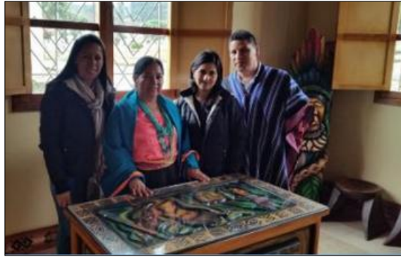
Grafico No. 6. Encuentro con la Autoridad tradicional, en la Casa Cabildo 2017.