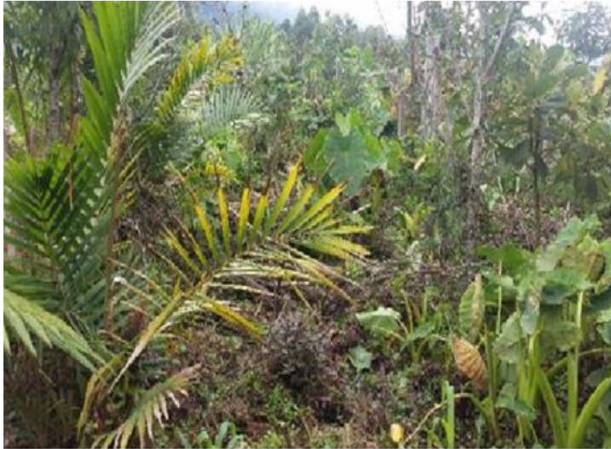
Grafico No. 3. Jajañ, Fuente: Muchavisoy, Juan Carlos 2017.

El Pueblo Kamëntšá, a pesar de la pérdida cultural que ha tenido que afrontar, especialmente a partir de la colonización; se fortalece cada día en su sitio de origen en Bëngbe Uáman Tabanok, su lugar sagrado de origen; hoy conocido como Valle de Sibundoy, Kamëntšá Yentšá, de donde, con pensamiento y lengua propia; pueden compartir al mundo sus prácticas ancestrales y comunitarias del buen vivir, que están implícitas en la Lengua Kamëntšá y explícitas en su quehacer diario. A continuación se describen algunas de esas prácticas que hacen posible el vivir bien, el vivir tranquilos - Natjëmban Jisoñam.