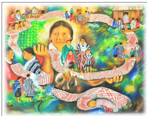
Grafico 4. Ruta Jenebtbiaman y Jenoyeunayám; tomado de Plan de Salvaguarda Pueblo Kamëntšá, 2014.

Desde el paradigma cualitativo, la apuesta investigativa fue abordada desde la perspectiva etnográfica que permitió, no solo describir la cultura Kamëntšá, sino comprender los fenómenos a partir de la vivencia y observación de sus comportamientos en diferentes contextos, para la comprensión de las prácticas del buen vivir en la Institución Etnoeducativa Rural Bilingüe Artesanal Kamëntšá.