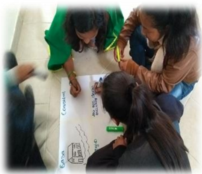
Grafico N. 12 Expresión Gráfica Colcha de retazos.

con argumentos donde sustentan ser afectados por fenómenos sociales como la globalización, tendencias postmodernas y lo que han tenido que luchar para que no se pierda su legado. Reconocen que ha habido un avance significativo en el reconocimiento y el respeto de los Pueblos indígenas; sin embargo falta trabajar mucho con la población indígena, especialmente para fortalecer el autoestima y eliminar la discriminación que trata de permanecer en la vida de hoy.