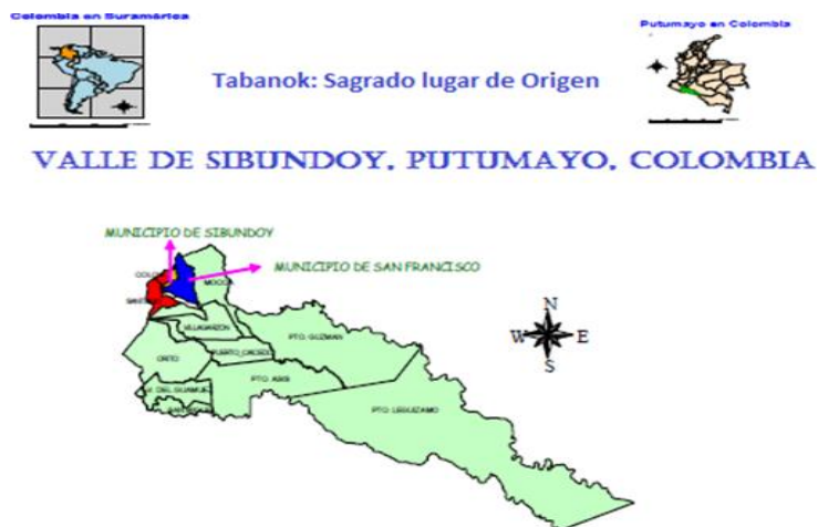
Gráfico No. 1 Ubicación geográfica.

La Institución Etnoeducativa Rural Bilingüe Artesanal Kamëntšá se encuentra ubicada en el Suroccidente de Colombia, en las estribaciones del macizo colombiano, al noroccidente del departamento del Putumayo, específicamente en el Valle de Sibundoy. En este territorio se encuentra el Resguardo indígena Valle de Sibundoy, organizado en seis Cabildos indígenas, ingas y Kamëntšá. Este espacio geográfico ha sido compartido con otros Pueblos que con el transcurso de los años han ido llegando por diferentes circunstancias sociales, tales como los procesos de colonización, el desplazamiento forzado o por el conflicto armado vivido durante muchos años especialmente en el medio y bajo Putumayo.