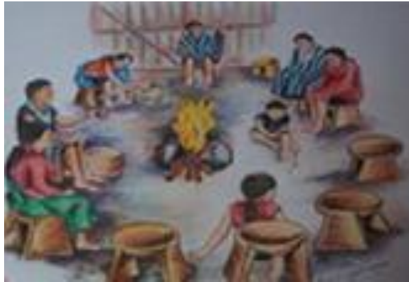
Grafico No. 9. Shinÿak, tomado de Estructura de Gobierno Propio Pueblo

de conversación natural, respetuoso y espontaneo para llegar a un acuerdo entre las partes, reconociendo la diversidad de pensamiento, alrededor de Shinÿak, la tulpa; sitio sagrado por su relación espiritual con el origen, el conocimiento y la vida.