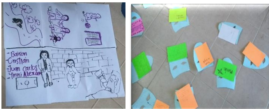
Grafico N. 11 Expresión Gráfica Cartografía social.

De otra parte, en el desarrollo de los talleres con los estudiantes, se identificaron y compartieron sentires, afectaciones, talentos y comprensiones propias desde sus experiencias de vida: