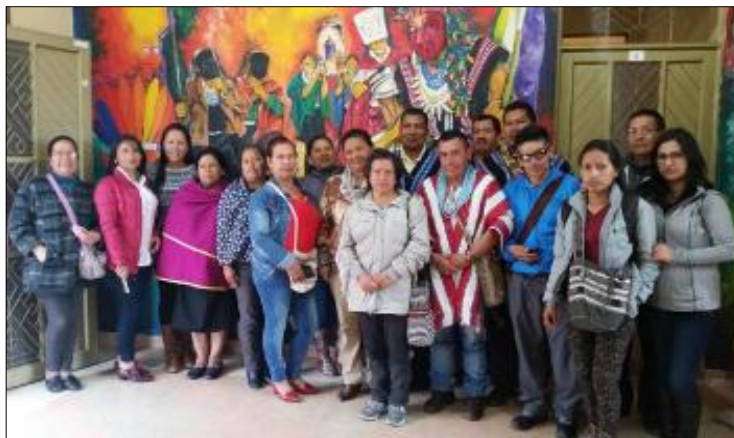
Grafico No. 7. Primer encuentro con autoridades y docentes de la Institución Etnoeducativa Rural Bilingüe Artesanal Kamëntšá, en la Casa Cabildo 2017.