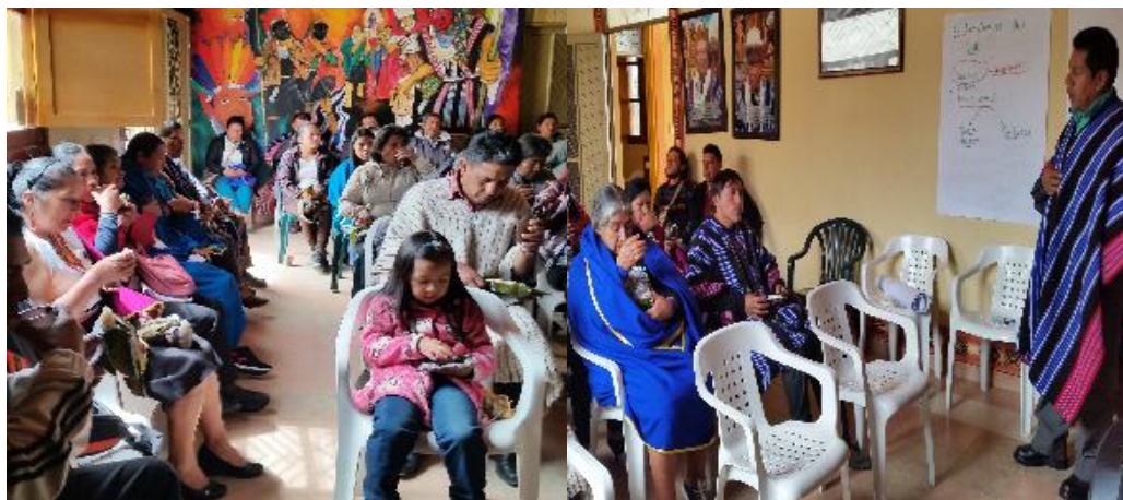
Foto No. 10. Conversatorio con Autoridades, docentes, sabios y comunidad

“es que hay tensiones también internas, entonces škenĚng mondentsaian ka rompamos ese paradigma interno porque hay tensión entre el Colegio Bilingüe con el Cabildo porque no hay ese acompañamiento; hay tensión interna entre la misma institución entre el directivo con los docentes, en el uso de la lengua, el cumplimiento únicamente de los lineamientos del Estado por parte de algunos docentes; entonces eso es un compromiso de nosotros de romper esa tensión primero que haya ese acercamiento”.