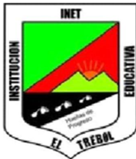
Imagen 1. I.E. el Trébol