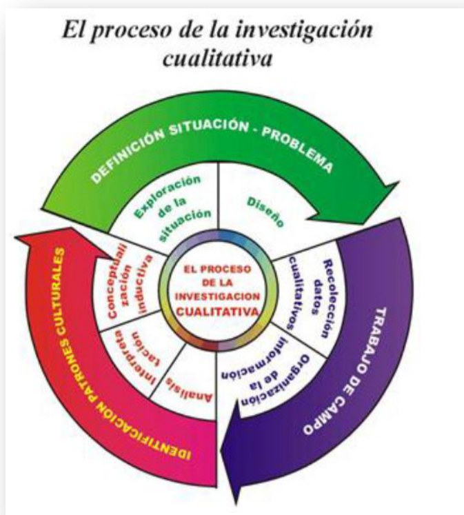
Figura 1. Proceso de la investigación cualitativa