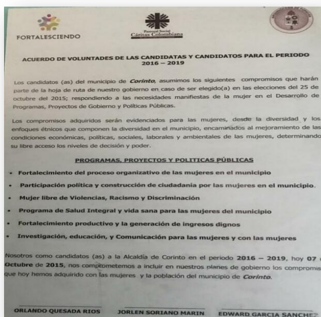
Figura 3. Acuerdo de voluntades. Programas y proyectos políticas públicas de la mujer.

pues deseábamos ser visibles a nivel político hoy en día tenemos una Secretaría de la mujer, creamos la red de mujer, el consejo consultivos y tenemos política pública de la mujer, nos hemos aliado con la Secretaría departamental y buscamos alianzas con el sector empresarial, frente al desempeño, y la promoción y prevención de derechos. Y además vamos a ser muy activas en las próximas campañas a alcaldías y gobernaciones, no podemos perder el impulso.