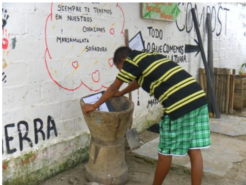
2. Uso de letreros distribuidos por el espacio