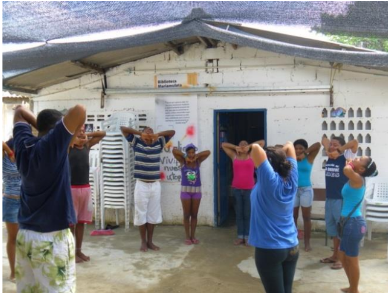
1. Actividades de disposición