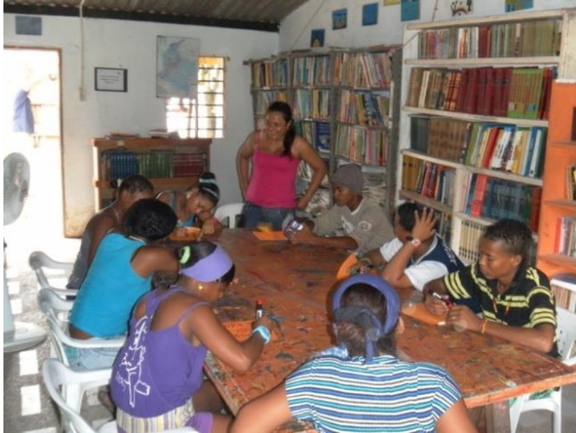
3. Clima de confianza, reconocimiento y respeto