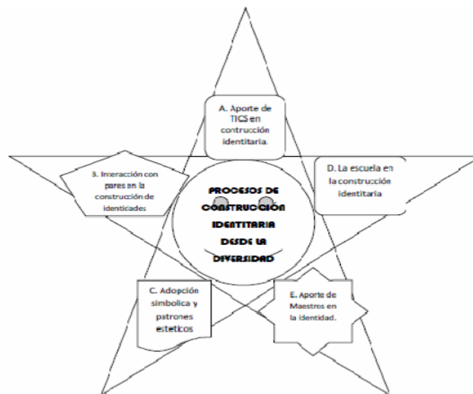
Figura N° 1. Categorías de análisis Elaboración propia

Después del acercamiento a las realidades institucionales se aprecia que en los procesos de construcción identitaria los y las jóvenes manifiestan variadas influencias en los espacios escolares para su consolidación. El esquema evidencia las categorías de análisis alrededor del tema de investigación y cada una de ellas se encuentra en una figura diferente debido a la diversidad encontrada en todos los escenarios educativos. Además, la estructura responde a unas características particulares pero que necesariamente deben estar vinculadas entre sí, ya que son importantes para la construcción identitaria en los educandos.