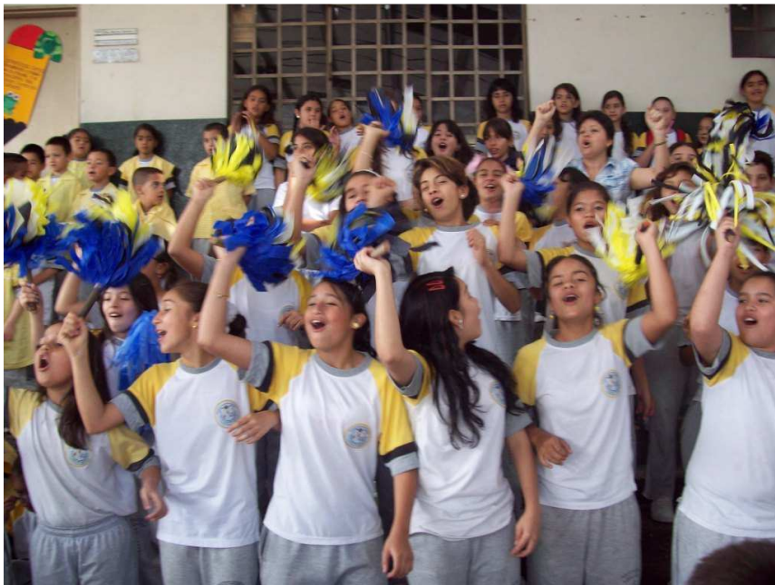
Acto Protocolario Feria de la Ciencia Sede San Rafael, Cuartos y Quintos