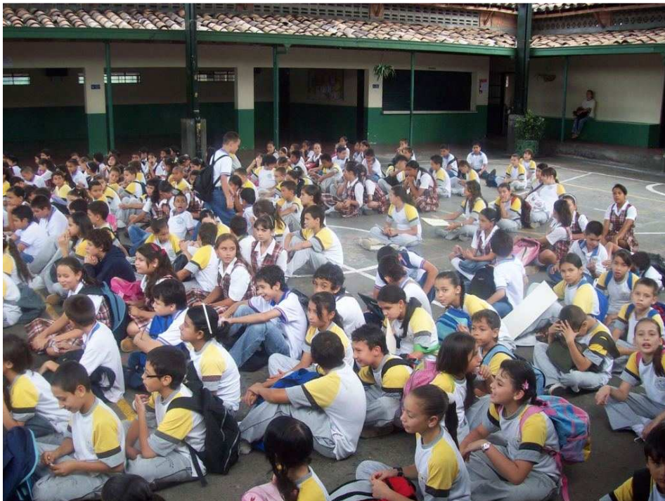
Manifestaciones de resistencia. Estudiante de Cuarto Sede Pio XII