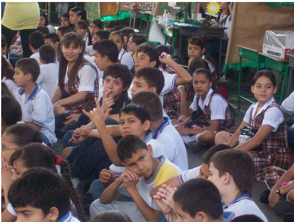
Organización de los grupos en el patio por filas, Actividad de disciplina. Sede San Rafael