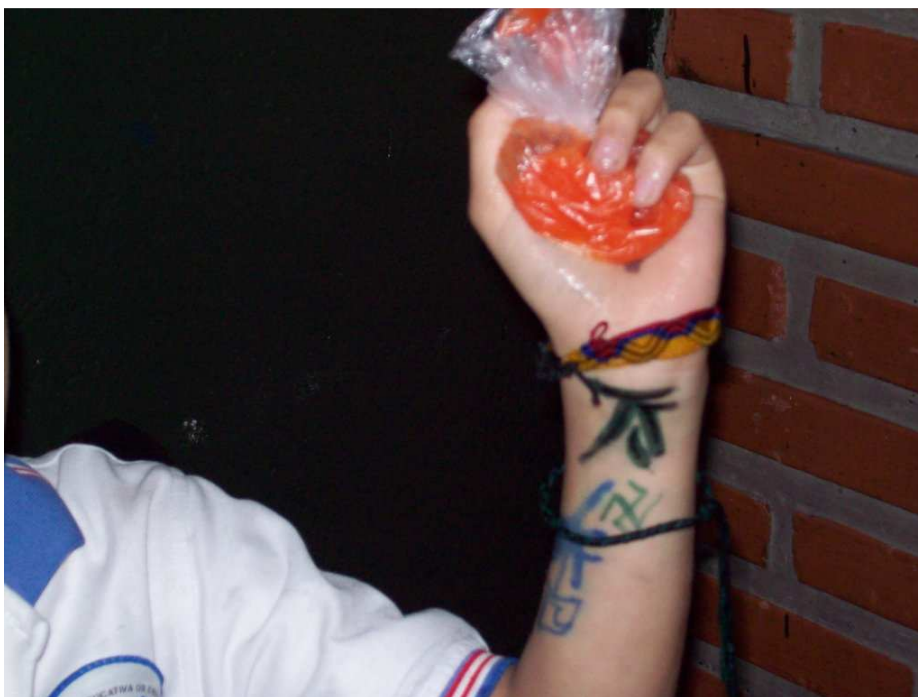
Clase de educación física Grupo Primero Sede San Rafael