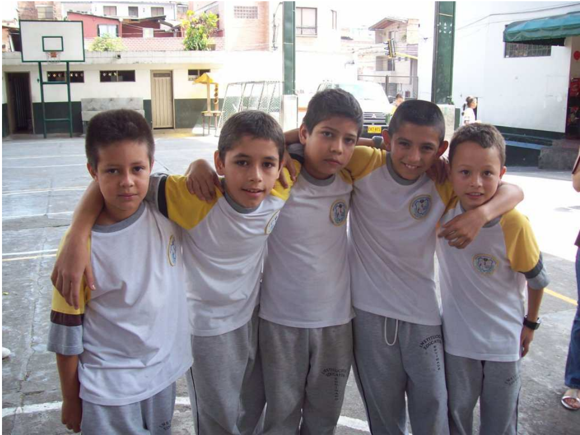
Niños de Quinto Sede Pio XII. Celebración campeonato de Interclases