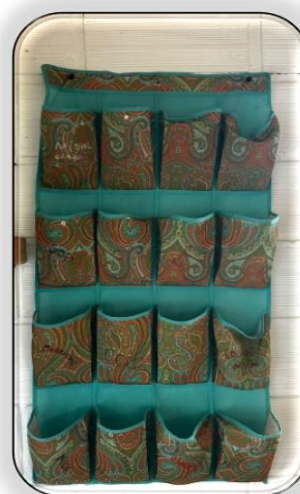
Figura 3 Estrategia: zapateros