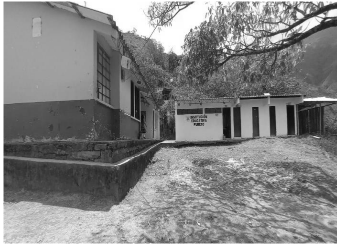
Fachada de la Institución Educativa Pureto (agosto de 2023)