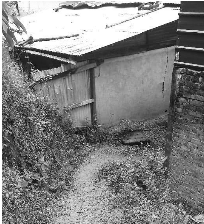
Camino de llegada a la Institución Educativa Pureto (agosto de 2023)