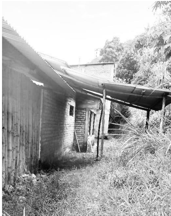
Patio interior de la Institución Educativa Pureto (agosto de 2023)