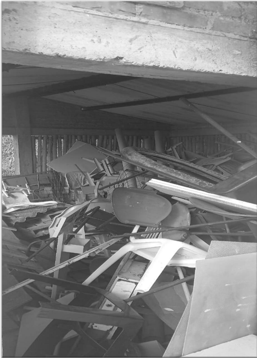
El aula abandonada (junlo de 2023)