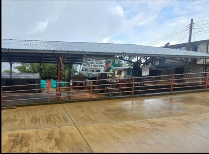
GEOGRAFÍAS DEL CONFLICTO EN PURETO