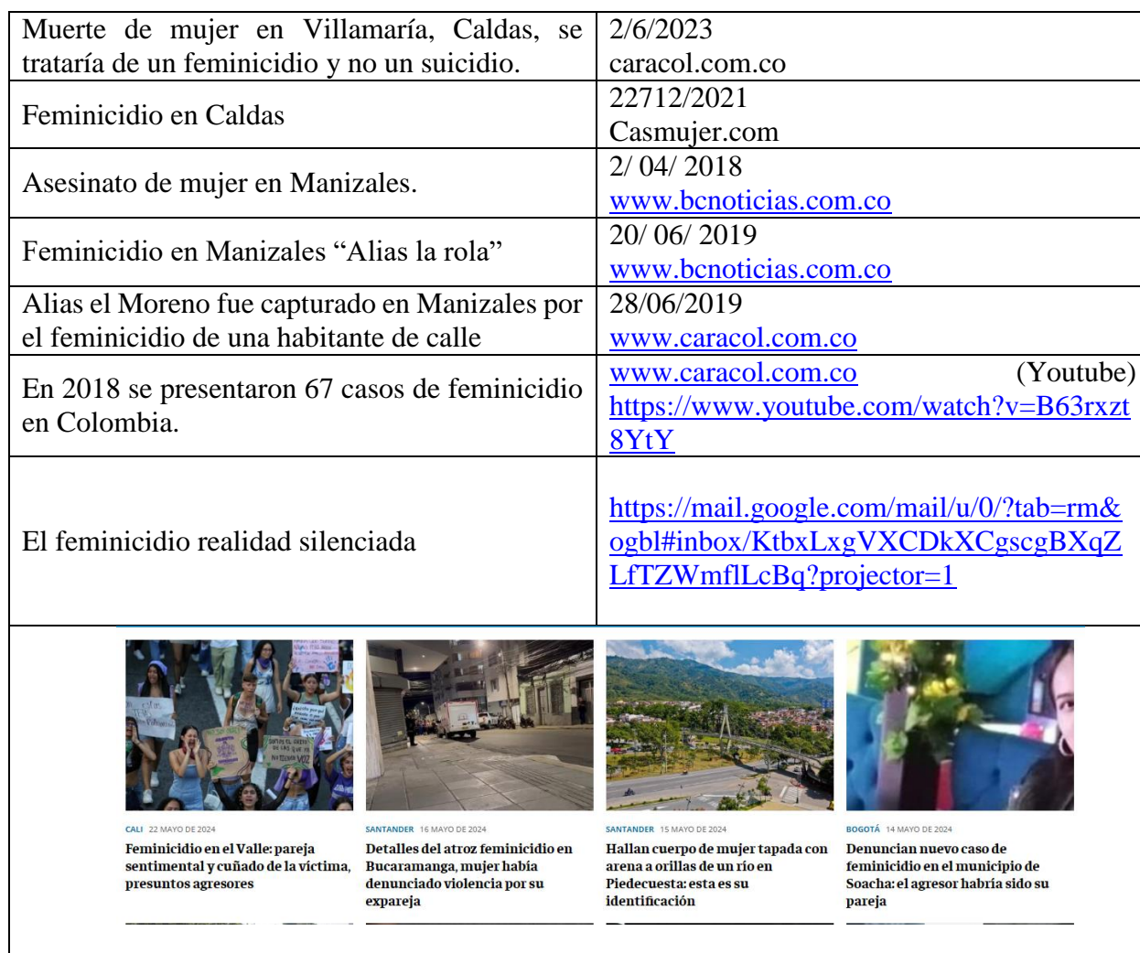
Tabla 1. Noticias de feminicidio

Al hacer una revisión de diferentes medios digitales y las noticias relacionadas con el feminicidio, se destacan: