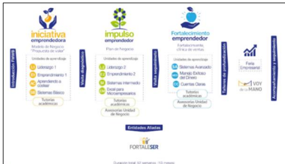
Figura 2. Estructura de la ruta 2 (Ruta de transición).

durante los ciclos 1 o 2, se centraba en las unidades de aprendizaje y las temáticas específicas abordadas en esos ciclos. Esta reestructuración permitió una mayor eficacia y cohesión en el programa de capacitación.