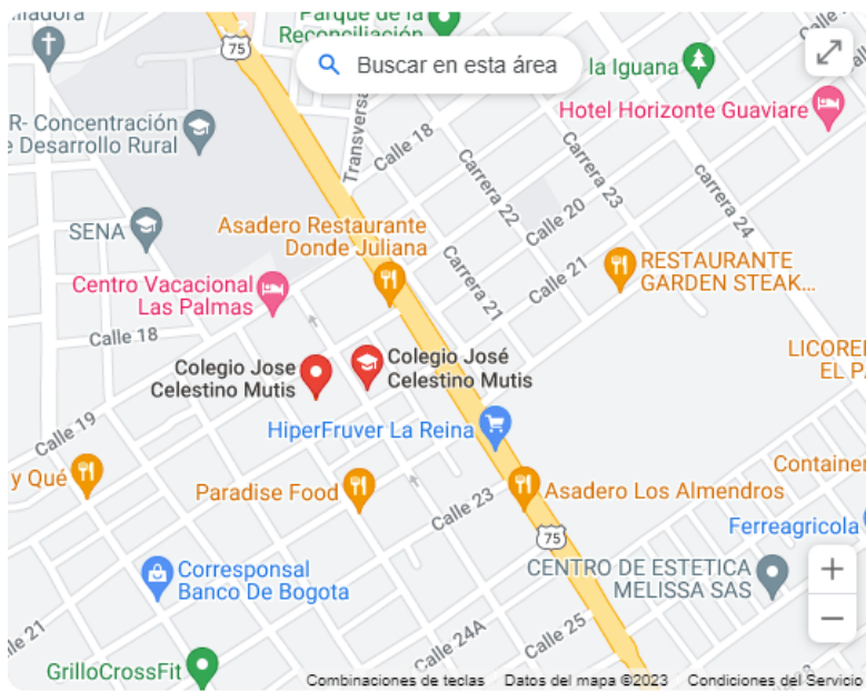
Ubicación de la Institución Educativa José Celestino Mutis