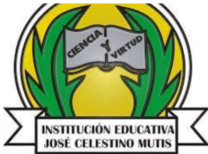
Escudo de la institución Educativa Jose Celestino Mutis (2023)