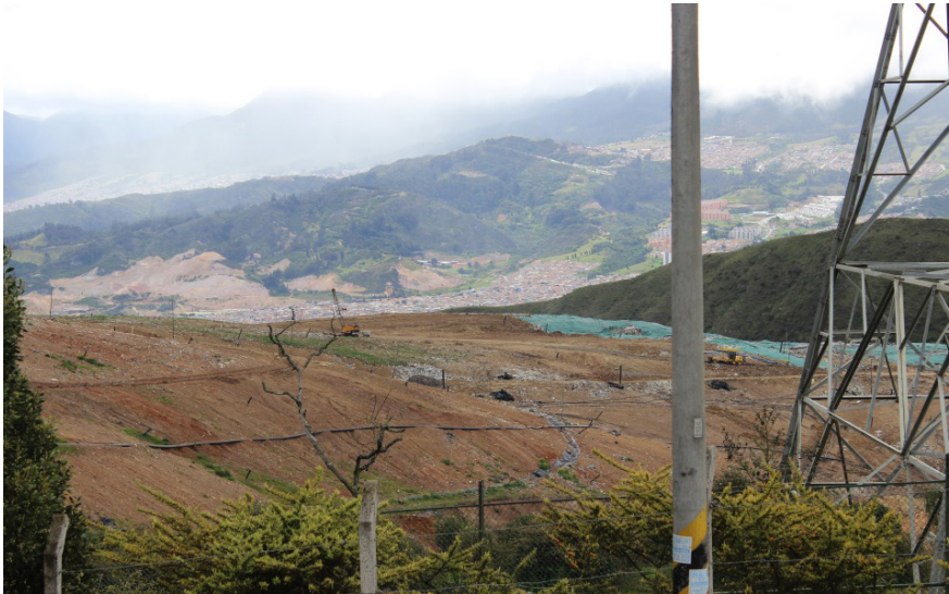
Figura 3. Relleno sanitario Doña Juana