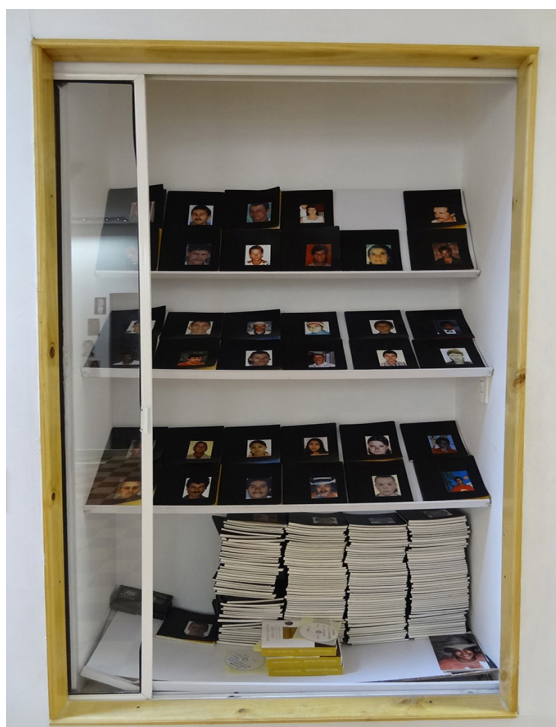
Imagen 2. Bitácoras.