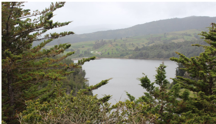
Imagen 4. Embalse La Regadera

Aquí arriba ya ondean banderas americanas, y banderas japonesas, peleándose por el páramo más grande, o sea, esta es la fábrica de agua más importante que tiene el planeta tierra y la tenemos nosotros. Era la paradita técnica para hablar lo que se llama la gobernanza del agua, porque así no lo vendieron para Latinoamérica, y es el gran proyecto que tiene Emgesa. Y no vienen como lo hicieron hace 500 y pucho de años, que vienen en La Niña, La Pinta y la Santa María. No. Ahora llegan al aeropuerto, y ya no vienen ni por oro ni por esmeraldas ni por carbón ni por petróleo ni nada de esa vaina, ellos vienen por esto, porque quien tenga el poder de esto, en las siguientes generaciones, tiene el poder absoluto (Líder comunitario).