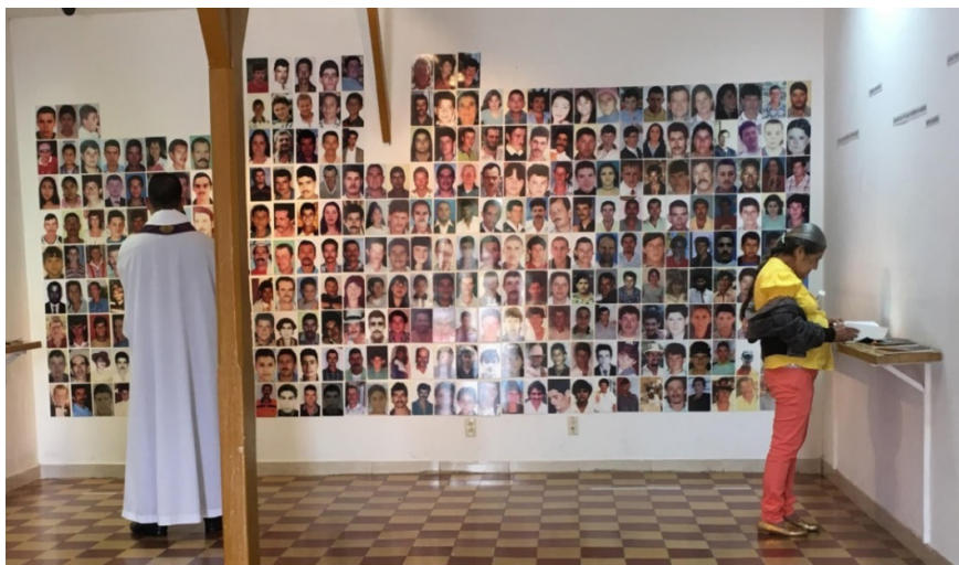
Imagen 1. Muro de fotos del Salón del Nunca Más. Foto tomada por Marda Zuluaga el 05/03/17