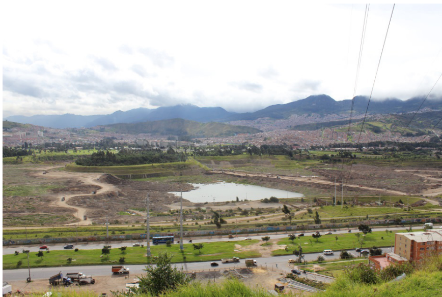
Imagen 2. Parque minero industrial