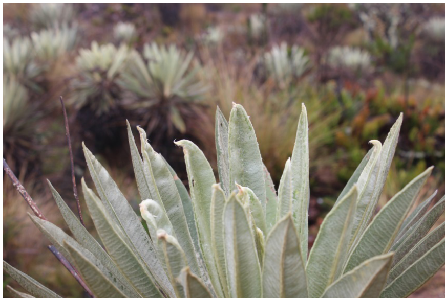
Figura 5. Frailejón. Páramo de Sumapaz

Antes de ingresar al páramo, nos reunimos para escuchar instrucciones y allí nos preguntan: ¿Qué es lo primero que uno hace al llegar a un lugar? Yo opto por conestar: Saludar. Después realiza una siguiente pregunta ¿Y qué más? Le respondo: Pedir permiso. Y efectivamente, él reitera la necesidad de ser respetuosos con el espacio que vamos a visitar, así que realiza un saludo en lengua Muisca y nos invita a recordar el propósito que nos ha llevado hasta ese lugar, el cual ya sea de índole personal y/o académico debe cumplirse hasta el final. En la medida que avanzamos nos reciben cientos de frailejones, lo cual interpreto como la puerta de entrada al páramo. Al ascender, la niebla se vuelve cada vez más intensa, la brisa y la ligera lluvia que cae logra congelarnos los huesos, lo cual tan solo es una prueba para el que quiera conocer las exhuberantes lagunas cargadas de historias y mitologías.