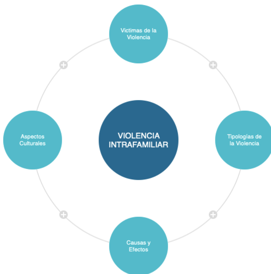
Gráfica No.2 Red Categorial