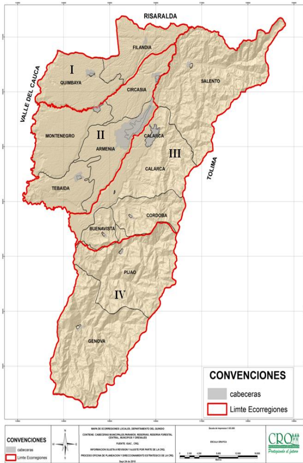
Mapa 2. Ecorregiones Estratégicas Locales del Departamento del Quindío.

plasmar en los resultados cartográficos de la zonificación del territorio. En el siguiente mapa se pueden apreciar las ecorregiones estratégicas locales identificadas: