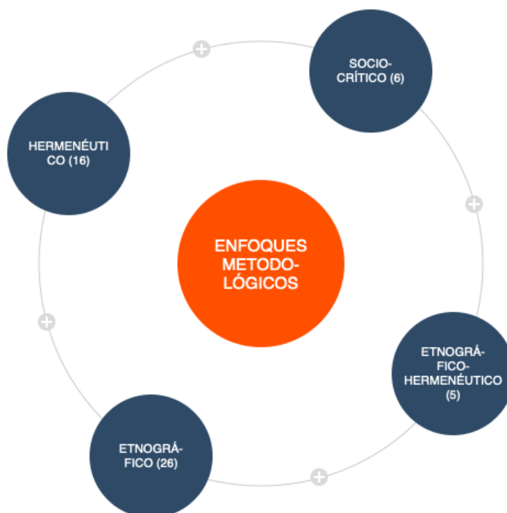
Figura 2. Enfoques metodológicos.

Etnografía: Este enfoque metodológico fue el privilegiado, en las investigaciones consultadas, debido al carácter comprensivo de los sujetos, en donde se aprende el modo de vida de una unidad social concreta, pudiendo ser ésta una familia, una clase social o una escuela. Permite interpretar el día a día del consumidor desde lo que hace y no sólo por lo que dice que hace, enfocados a comprender los códigos culturales que rodean a una marca o a un producto específico. (Peopple, 2015). Bajo este enfoque de abordaje, se integran 26 investigaciones entre las cuales se destacan: