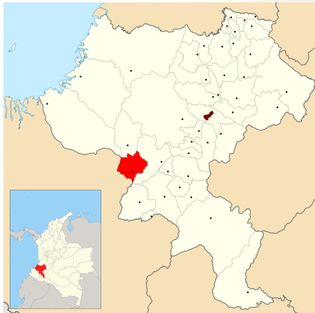
Imagen 2. Localización geográfica del municipio de Balboa, Cauca.

Uno de los municipios del departamento del Cauca es Balboa, el cual se encuentra ubicado cerca de la cordillera occidental de los andes colombianos al sur occidente del Departamento; posee un área aproximada de 402,83 Km 2 . De este total del área el 48% ( \approx 194 Km 2 ) se encuentra en pastos sin ningún manejo, el 32,31% ( \approx 130,15 Km 2 ) se encuentra dedicado a labores agropecuarias y un 5.35% ( \approx 21,55 Km 2 ) se encuentran en bosques naturales que tienden a disminuir por el mal manejo de las tierras agrícolas.