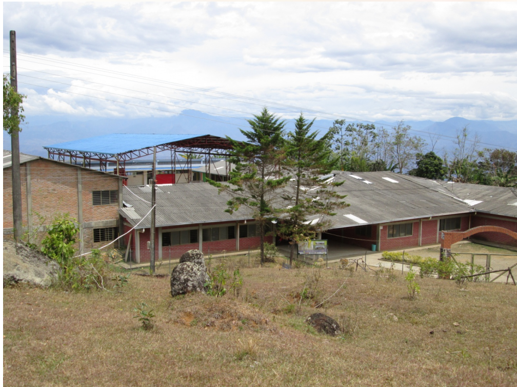
Imagen 3. Institución educativa Vasco Núñez de Balboa.

La institución educativa Vasco Núñez de Balboa, es una institución de carácter público, de modalidad académica, orientada y regida por personal profesional, con formación axiológica y