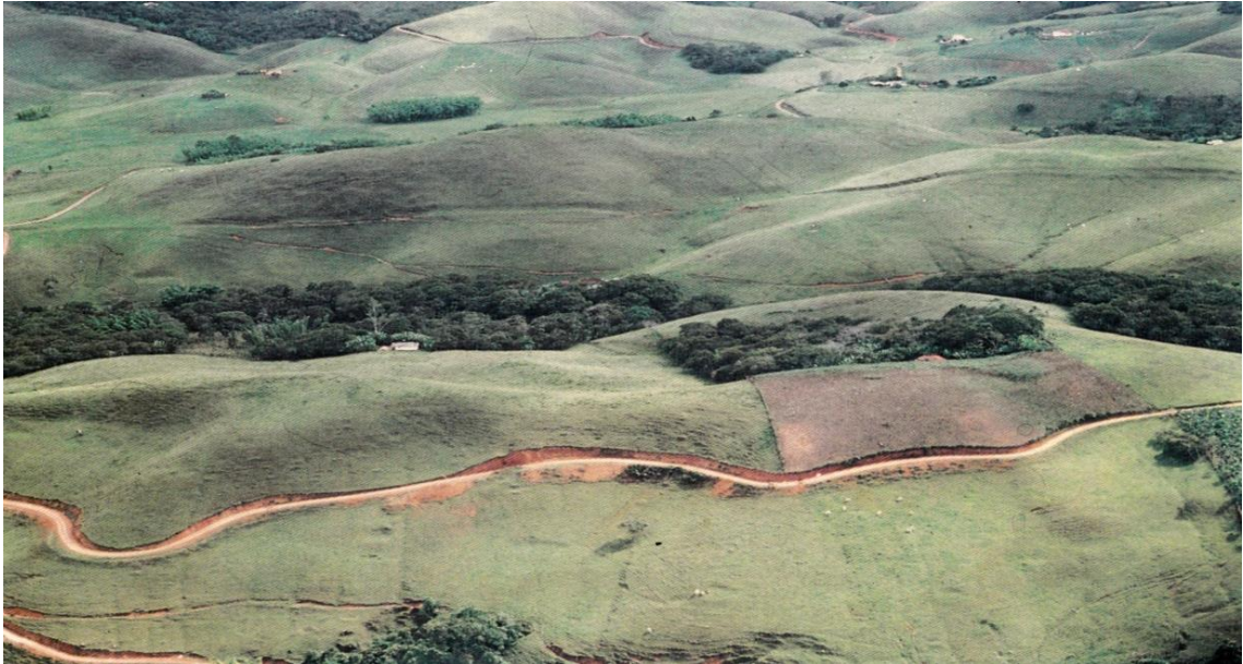
Ilustración 1 Campos de cultivo periodoonso con camino prehispánico arriba de la cañada. (Cardale de Schrimpff, 1992)

diferentes épocas, intervinieron en la transformación del paisaje de la zona. Esa transformación estuvo directamente relacionada, en la época precolombina, con el perfeccionamiento de las tecnologías de agricultura (roza y quema) 6 (Clavijo, 2016) y caza relacionadas con el aumento de la densidad de población humana. (Ver Ilustración 1 Campos de cultivo periodoonso con camino prehispánico arriba de la cañada. )