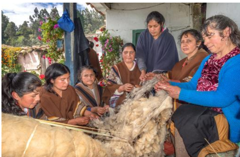
Gráfico No.17: el tejido involucra la unidad y bienestar de las mujeres Pastos.

Este referente cultural así como la chagra y el fogón permite el dialogo, el análisis la planificación e integración (urdir) de la conceptualización de la identidad cultural. Desde esta práctica especialmente la mujer Pasto le ha permitido la reivindicación de sus derechos desde una mirada colectiva para vivir en equilibrio y armonía, donde los derechos no solo son los que crean los seres humanos sino también los que vienen dados por la naturaleza basados en el respeto mutuo donde todos son un todo (Consejería mujeres pueblo pasto, 2012).