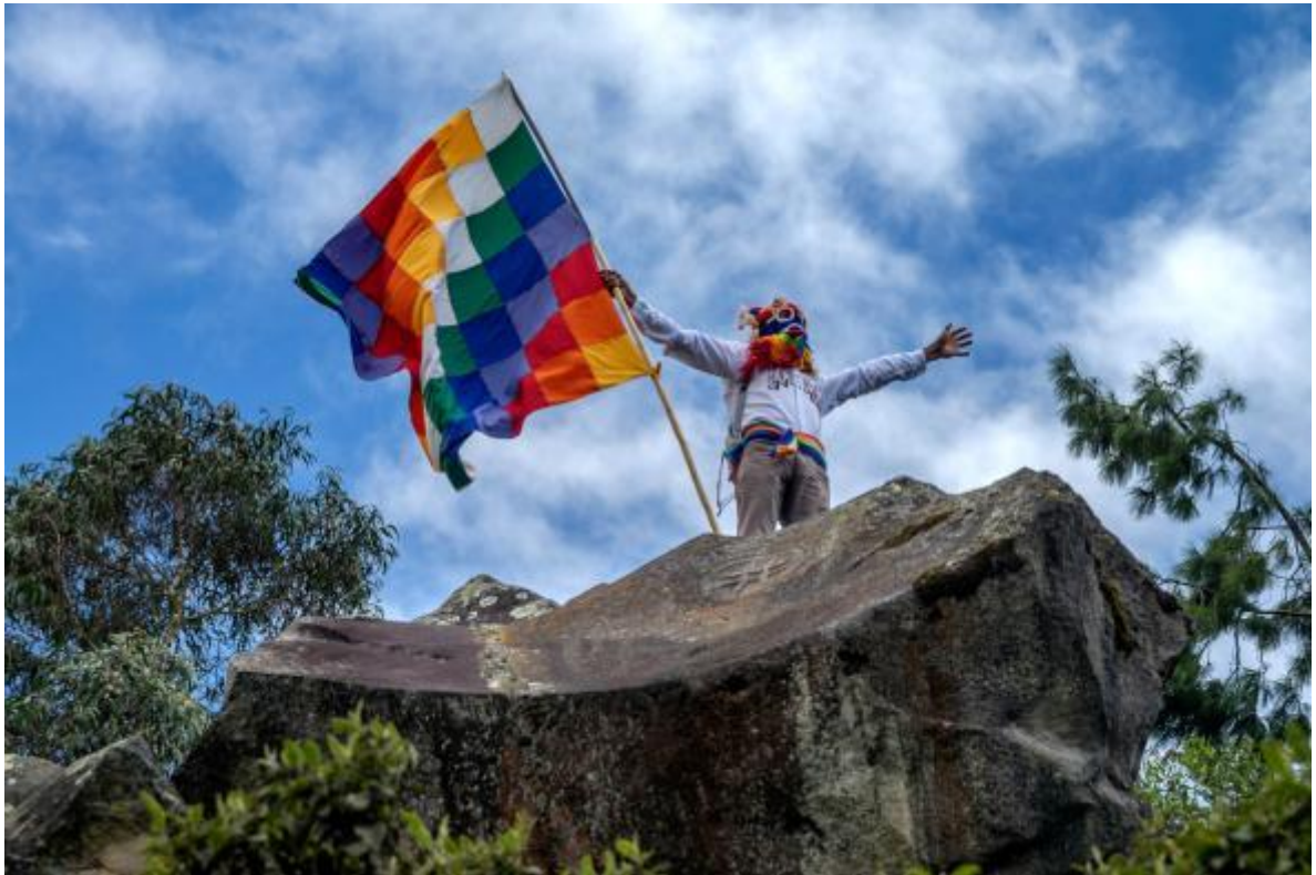
Gráfico No.26: Nuevos enfoques de desarrollo (vivir bien) desde la identidad cultural y el territorio

aspiraciones de libertad, equidad, dignidad, equilibrio y respeto al territorio como organismo vivo generador de vida con condiciones, biofísicas, sociales, políticas, económicas, educativas, institucionales, ideológicas y culturales deseables en el espacio y en el tiempo.