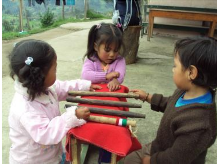
Gráfico No.12: Practica del derecho mayor desde la infancia