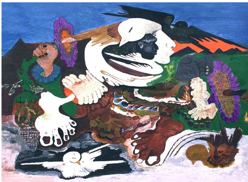
Gráfico No.4: Pintura del origen del territorio de los Pastos desde fuerzas y energías complementarias.