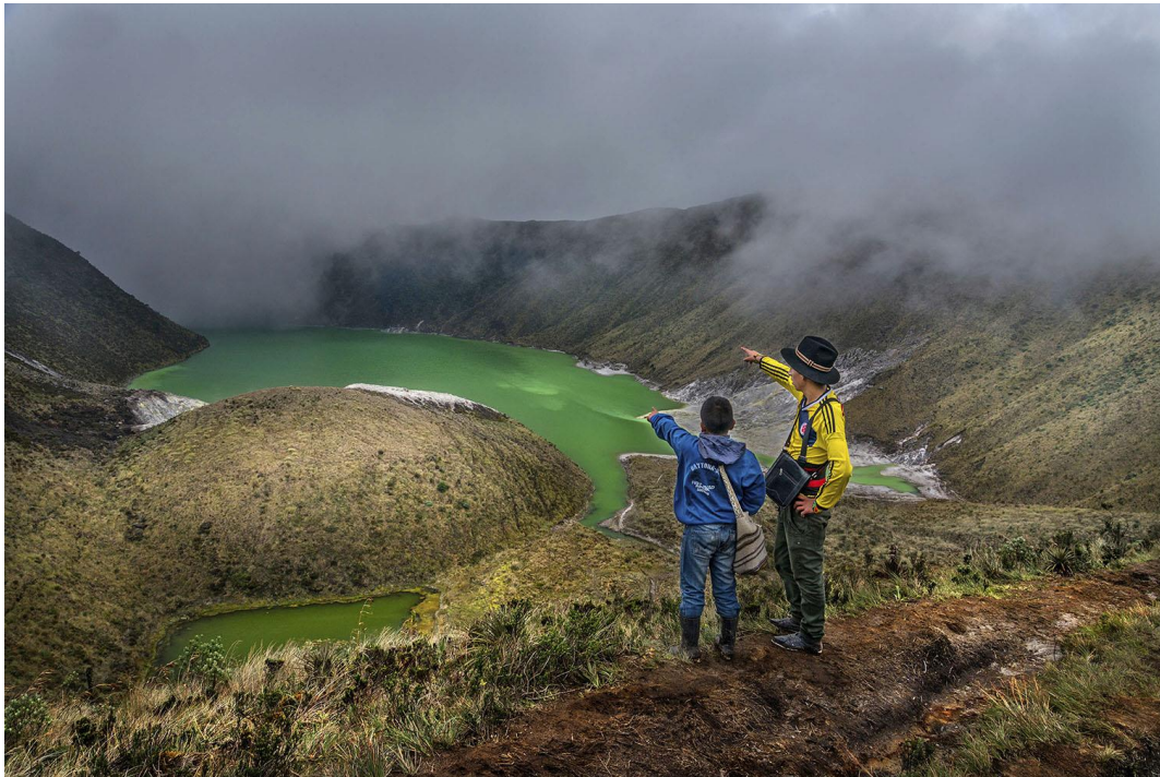
Gráfico No.3: Recorrido a la laguna Verde del Volcán Azufra-Resguardo Indígena de Tuquerres.

shaquiñán (camino) es reencontrarse con el mito, la leyenda, los espíritus, los pobladores naturales del territorio. Desde este referente, en esta investigación se realizó recorridos por el territorio para observar y conocer las áreas naturales (sitios sagrados) como ríos, lagunas, paramos, bosques, volcanes, cerros y demás riquezas naturales que posee este territorio. Para esto se utilizó una cámara fotográfica y una libreta de campo que permiten la recolección de información para su posterior sistematización.