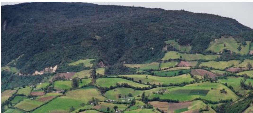
Gráfico No.23: Avance de la frontera agrícola en el resguardo indígena de Males Córdoba

Estas nuevas formas de producción han enfermado (crisis ambiental) el territorio; desde el monocultivo se hacen prácticas como la siembra de cultivos a favor de la pendiente, aplicación indiscriminada de agroquímicos, utilización de maquinaria pesada, tala de coberturas vegetales nativas, entre otras acciones antrópicas (humanas) que están degradando física, química y biológicamente el territorio; según la Convención de las Naciones Unidas sobre la lucha contra la desertificación (UNCCD) define la degradación de tierras como un proceso natural o una actividad humana que causan la incapacidad de la tierra para sostener adecuadamente las funciones económicas y/o las funciones ecológicas originales.