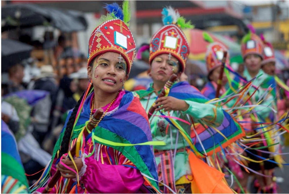
Gráfico No.22: fiesta del Inty Raymi donde se agradece al Sol por las cosechas y los frutos de la tierra

Desde estos referentes culturales agrupados en la dimensión ideológica y educativa y teniendo en cuenta los postulados teóricos se puede afirmar que la vida se origina en el territorio como resultado de una secuencia de acontecimientos o fenómenos complementarios que se explican desde la ley de origen y dualidad andina, sujeto a leyes naturales. También se vislumbra que desde estos referentes la sagralidad y espiritualidad que se le da al territorio es una de las condiciones fundamentales que le han permitido la sostenibilidad del territorio en el tiempo, pues lo sagrado implica respeto, veneración y culto.