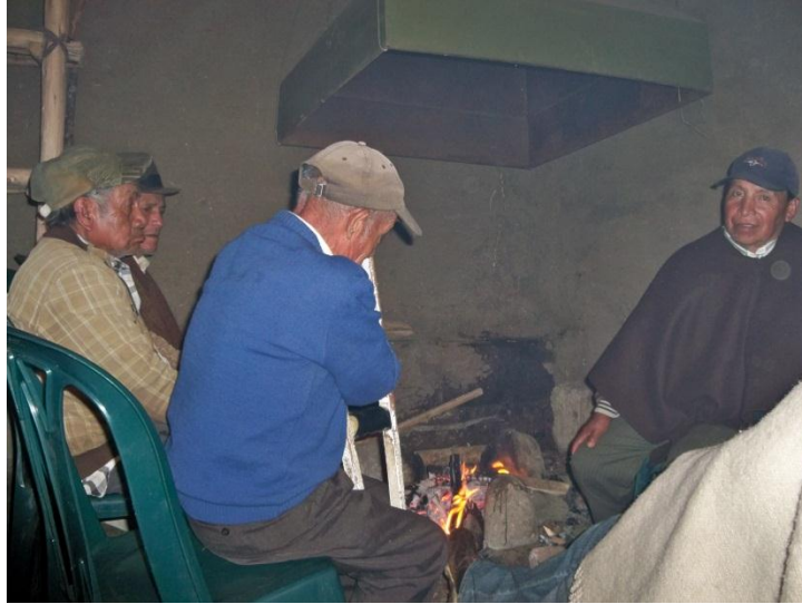
Gráfico No.10: El fogón espacio donde se atiza la sabiduría ancestral

andino y en éste el territorio de los pastos, no puede existir sin la articulación del amazonas y del pacífico.