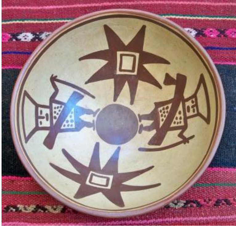
Gráfico No.13: cerámica donde se muestra la cosmocracia andina

acompañado de un conjunto de ideales, conocimientos, creencias, usos y costumbres.