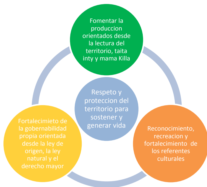
Grafico No. 25: lineamientos de sostenibilidad del territorio de los pastos

A partir del análisis realizado no es casual determinar que desde una situación de profundas desigualdades sociales, políticas, económicas, educativas, institucionales, ideológicas y dramáticos desequilibrios territoriales, emerja desde el pueblo de los Pastos una ruta diferente y alternativa de desarrollo sustentado desde la identidad cultural y el territorio. En la siguiente grafica se muestra la visión de desarrollo que tienen los pastos; orientados desde sus referentes culturales entre ellos el fogón que enseña el equilibrio desde las tres tulpas para sostener la vasija (territorio) dando a entender que el territorio de los pastos y su comunidad no puede existir sin la articulación de las diferentes dimensiones de la cultura pasto.