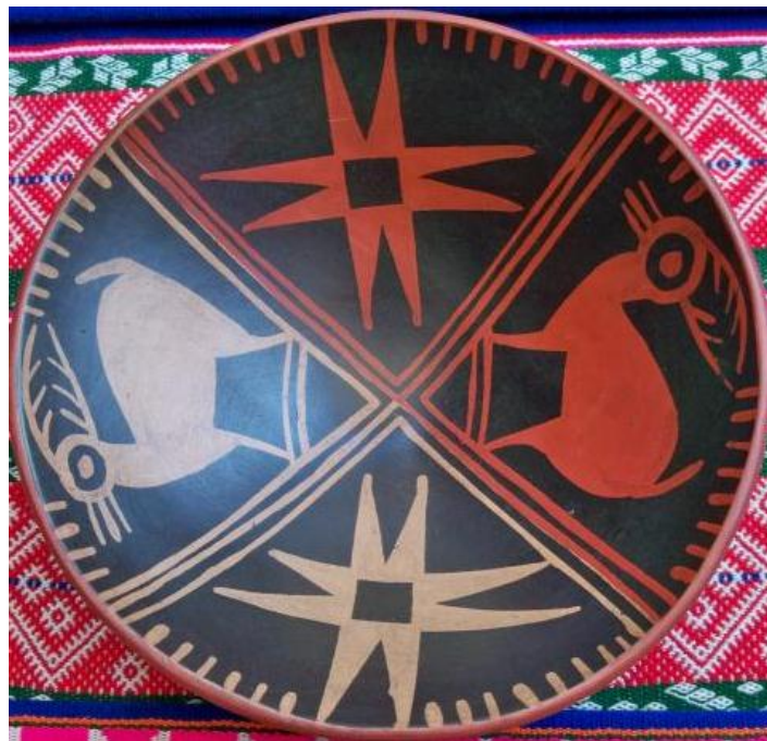
Gráfico No.6: Cerámica donde se representa la dualidad Andina.

Es un referente que orienta en la forma de vivir y de permanecer sin alterar, sin contaminar y sin destruir la naturaleza, la dualidad representa equilibrio, complemento, reciprocidad, igualdad, compensación, solidaridad y armonía. Para la psicóloga Milena Tarapues la dualidad andina representa el equilibrio en la diferencia, como lo pasivo y lo activo, el sol y la luna, el día y la noche, lo frío y lo caliente y demás fuerzan o energías que originan y mantienen la vida (M. Tarapues, entrevista personal, 2019). Para los pastos todo es sagrado y complementario donde se forja el respeto hacia todo.