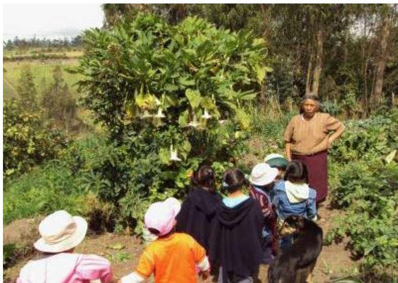
Gráfico No.9: La chagra como escenario pedagógico de educación propia.

La educación también está basada en la lectura del tiempo, por lo que se dice que desde la constante lectura del tiempo sagrado sustentado en taita inty (sol) y mama killa (luna) se aprendió las temporalidades de invierno y de verano para ser aplicadas a la siembra, manejo y cosecha de la chagra, así como la planificación de cada una las actividades que desarrollan los Pastos (A. Ruano, entrevista personal, 2019).