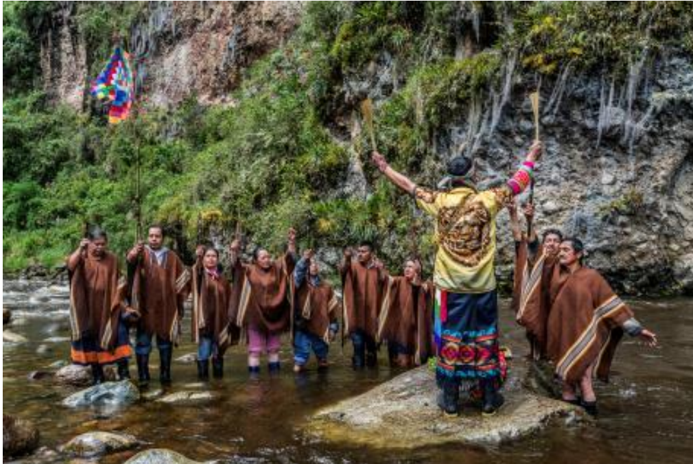
Gráfico No.15: Ritual de purificación del bastón de mando cabildo indígena del Gran Tescual.

Desde este referente cultural también se instauro el respeto al territorio puesto que cuando se adjudica un retacillo de terreno al miembro de la comunidad, la Vara de justicia es colocada sobre la tierra en señal de respeto.