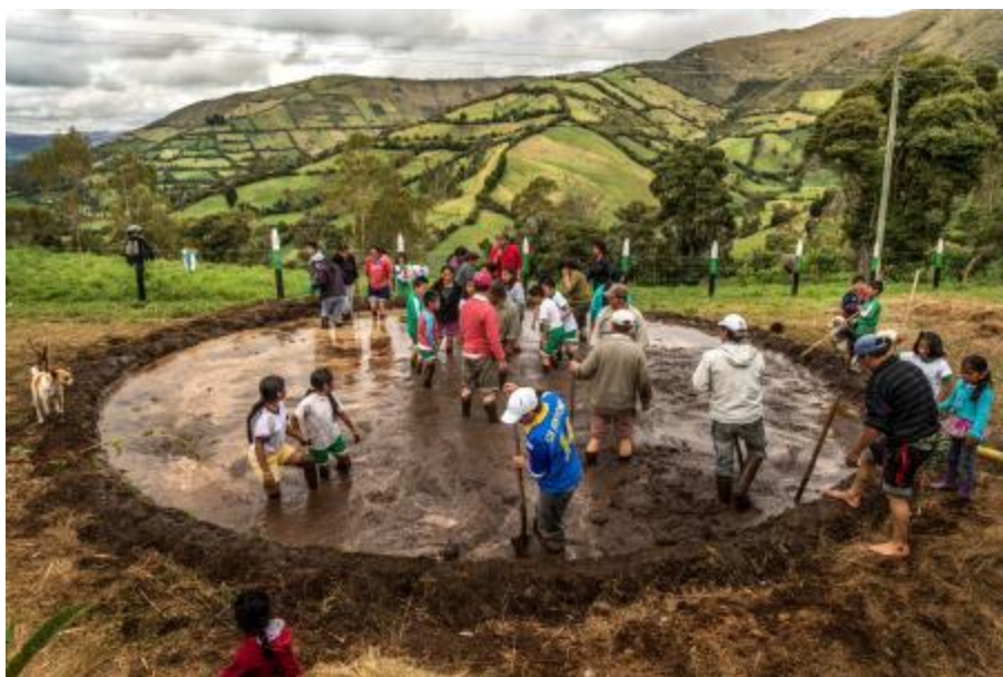
Gráfico No.19: Minga de construcción de una casa del saber

Espacio y forma que consiste en la reunión de la comunidad para desarrollar actividades comunitarias, arreglo de caminos, construcción de obras, casas comunitarias, acueductos, puentes, reforestaciones, mantenimiento de vertientes de agua y otras actividades. En este espacio las comunidades además del trabajo unen y crean pensamiento, ideas y alternativas comunitarias futuras, dialogan alrededor del quehacer comunitario.