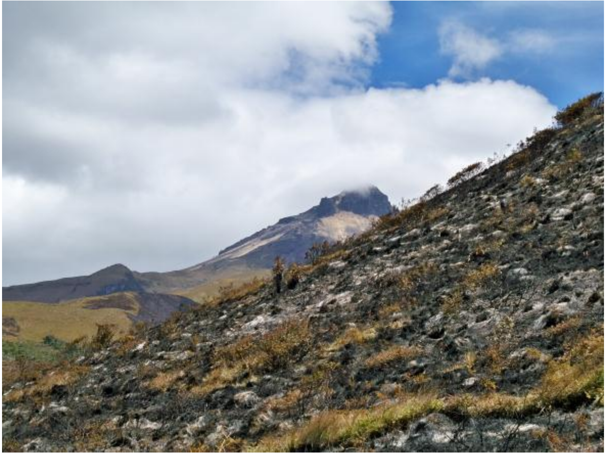
Gráfico No.24: quema de áreas naturales de paramo en el resguardo de Cumbal.

En este contexto, solo para citar un ejemplo de ello tomamos el Resguardo de Cumbal uno de los 24 resguardos que conforman el territorio de los Pasto, en el que encontramos que: