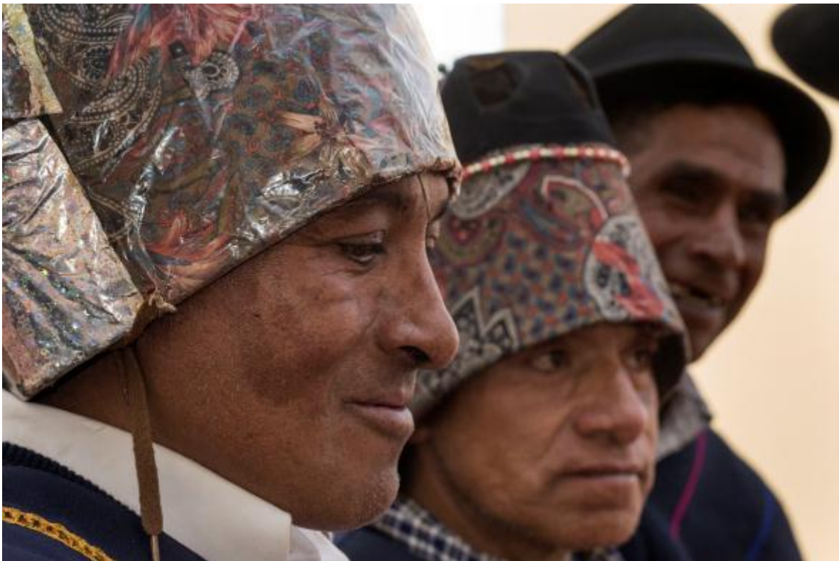
Gráfico No.2: Taitas del pueblo de los Pastos, población objeto de estudio