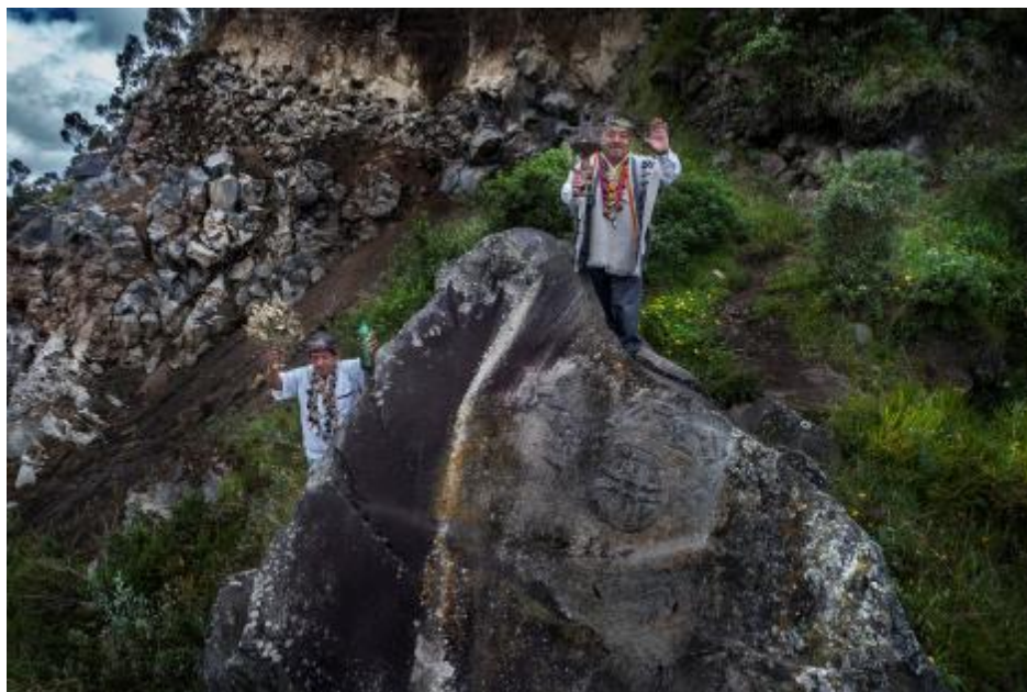
Gráfico No.14: Autoridades propias en el sitio sagrado del petroglifo de la piedra de los Machines.