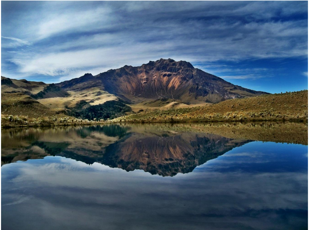
Gráfico No.21: Volcán Chiles-Resguardo Indígena de Chiles, para los pastos es el “taita chiles” y “mama Cumbal” dan origen a la diversidad ecosistemica del territorio.

El territorio todo lo tiene y todo es común, cada parte de su organismo es vital, si algo le sucede a uno de sus órganos sufre todo el cuerpo, por lo que el desequilibrio provoca síntomas y reacciones adversas para quienes habitan en él, y por ello hay que cuidarlo y respetarlo con una serie de actos, tanto físicos como espirituales.