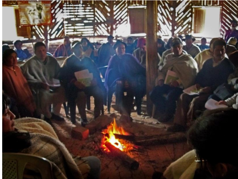
Gráfico No.11: Minga de pensamiento alrededor del fogón