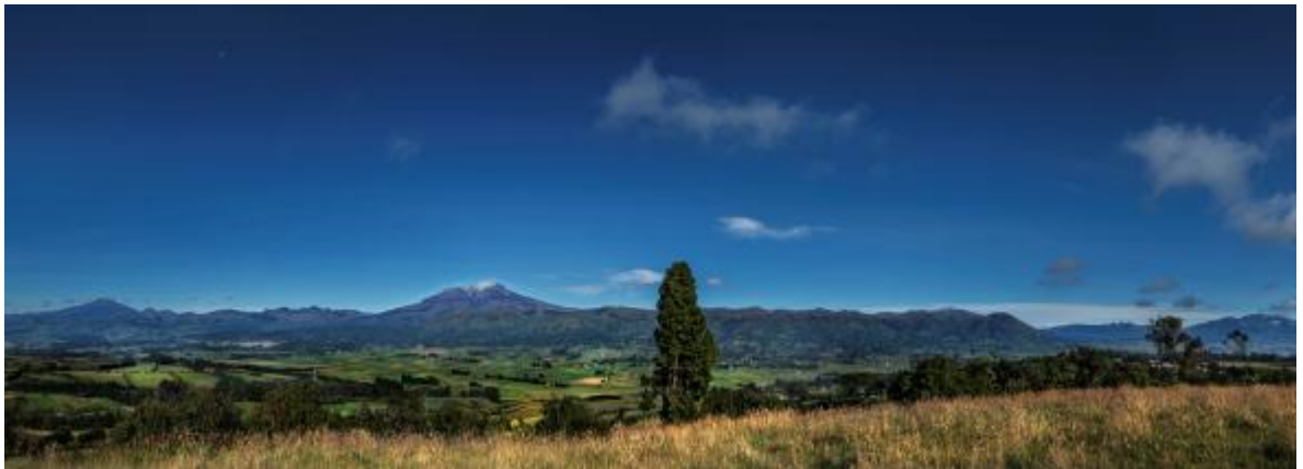
Gráfico No.20: Al fondo de izquierda a derecha está el volcán Chiles, Cumbal y Azufra, que para los pastos son lugares sagrados por donde respira el territorio.

De allí el entendimiento sobre el origen y existencia de los ecosistemas naturales o sitios sagrados de enorme biodiversidad: bosques, paramos, lagunas, humedales, volcanes, cerros, ríos y lugares cósmoreferenciales con símbolos y significados naturales y culturales, concebidos como centros energéticos y magnéticos, reguladores climáticos e hidrológicos.