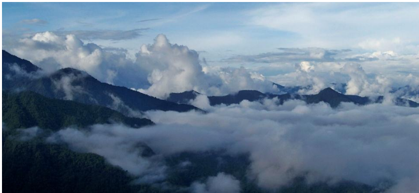
Gráfico No.5: Movimiento del agua desde el pie de monte amazónico hasta el nudo de los pastos en una relación Panamazonica.

Esta ley es uno de los fundamentos de la cultura de los pastos, para esta comunidad es el conjunto de normas objetivas que rigen el movimiento de la naturaleza y el cosmos independiente de la voluntad del hombre, el hombre es parte de esa ley y tiene que respetarla, esta ley el ser humano así quisiera no puede cambiarla dado que nace desde el nacimiento del territorio. De acuerdo a las mingas de pensamiento de los Pastos esta ley está representada en el territorio, la tierra y el universo donde todo se mueve y se relacionan en cada uno de los ciclos naturales del agua, del suelo, de los elementos, de los seres vivos y demás fenómenos naturales.