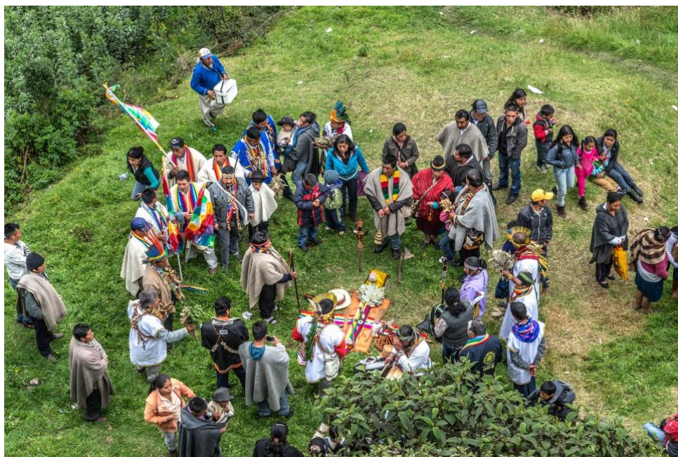
Gráfico No.7: Ritual de armonización para dar inicio a la fiesta del inty raymi.

En observación no participante de rituales de armonización realizados en el resguardo de Cumbal en fiestas del inty raymi de los años 2015, 2016 y 2017 se pudo observar que el ritual era la forma de preparación espiritual que los andinos practicaron milenariamente para lograr el equilibrio y convivencia con todo, en el ritual es donde se manifiesta la sagralidad como el principio del respeto, veneración y culto, ya que todo tiene espíritu, por ello no se puede alterar ni profanar.