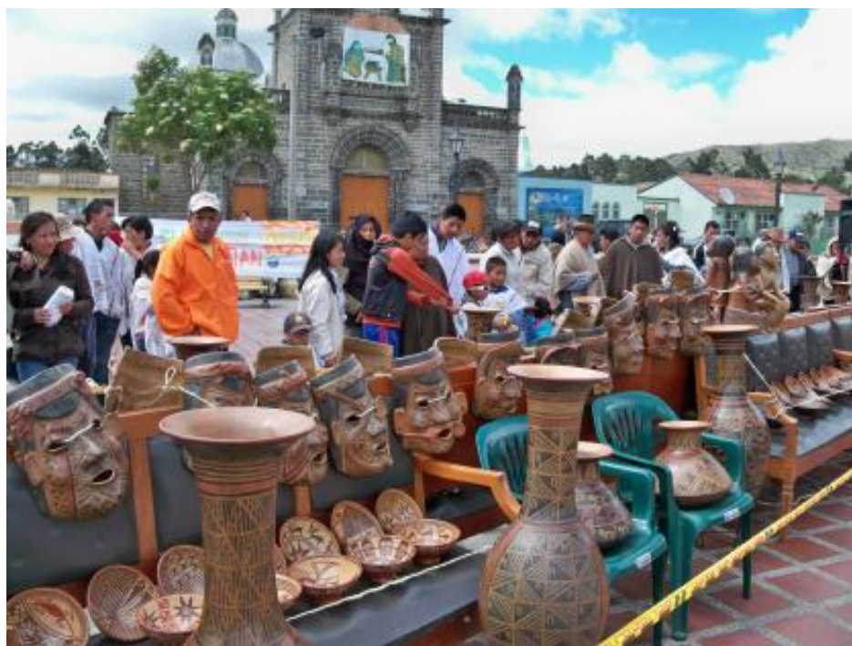
Gráfico No.18: Exposición de cerámicas del pueblo de los Pastos en el Resguardo de Cumbal.

En el pueblo pasto se encuentra una gran diversidad de cerámicas que dejan ver las manifestaciones culturales y artísticas de esta comunidad.