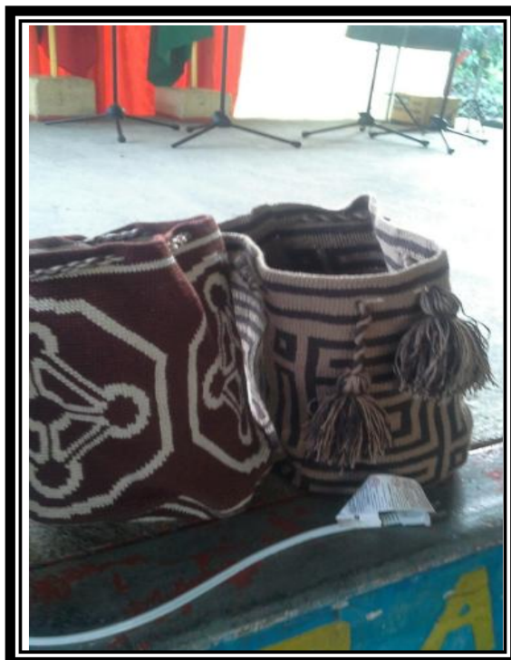
Imagen 10 mochilas