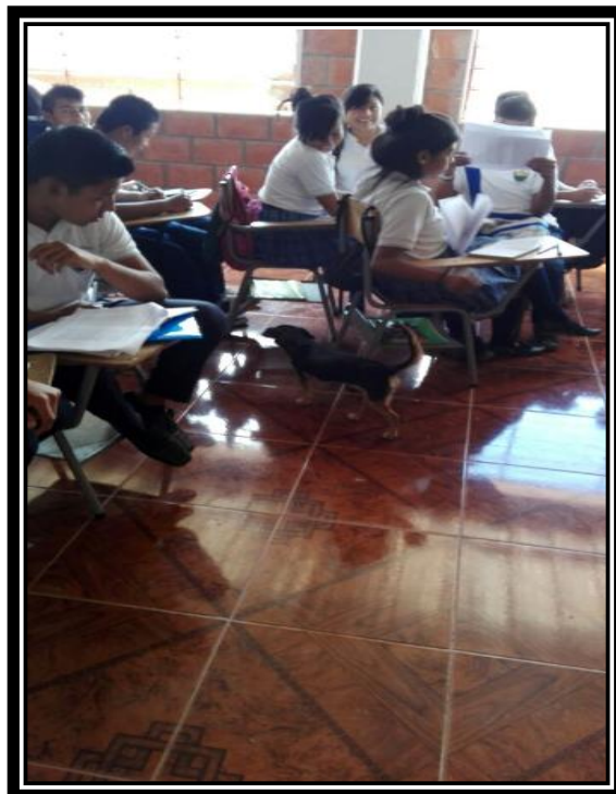
Imagen 16 Actividades pedagógicas