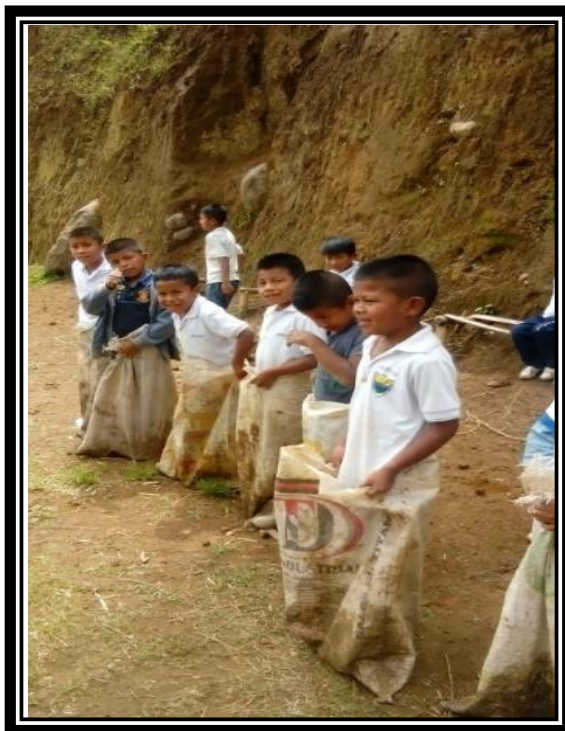
Imagen 14 Juegos tradicionales