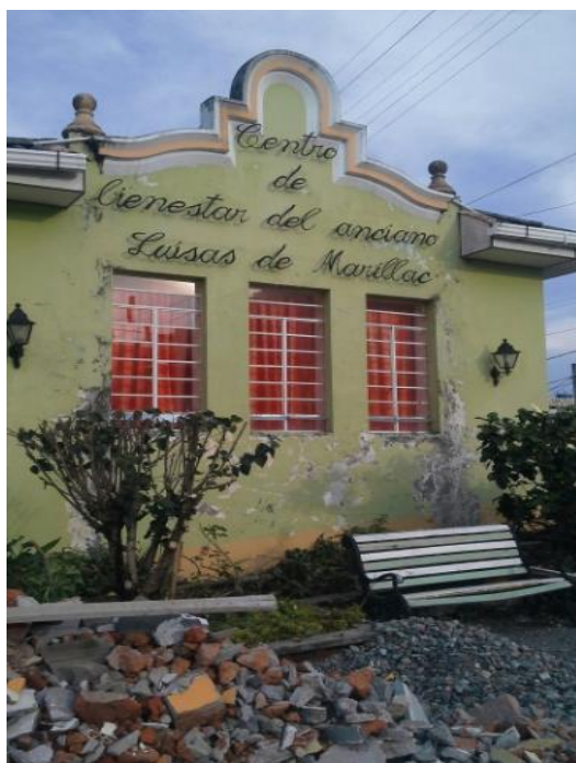
Imagen 21 Arte con reciclable