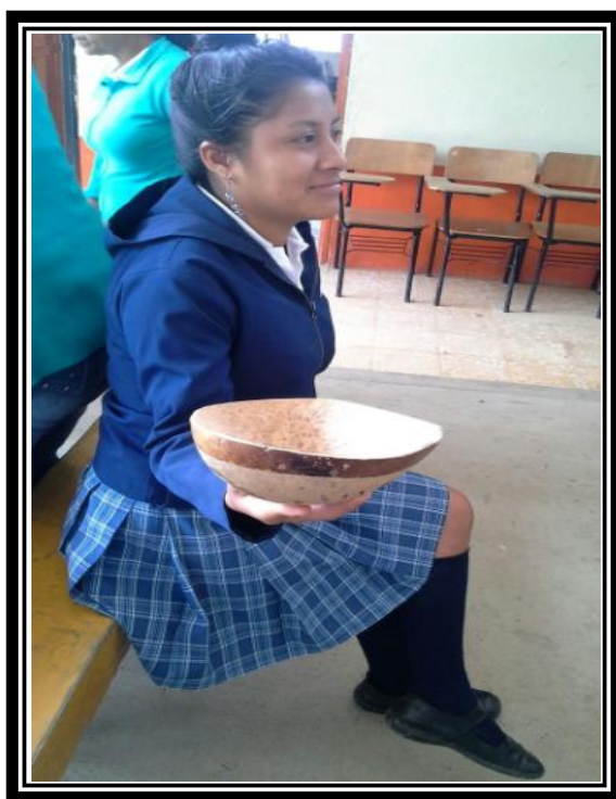
Imagen 20 Vasija tradicional