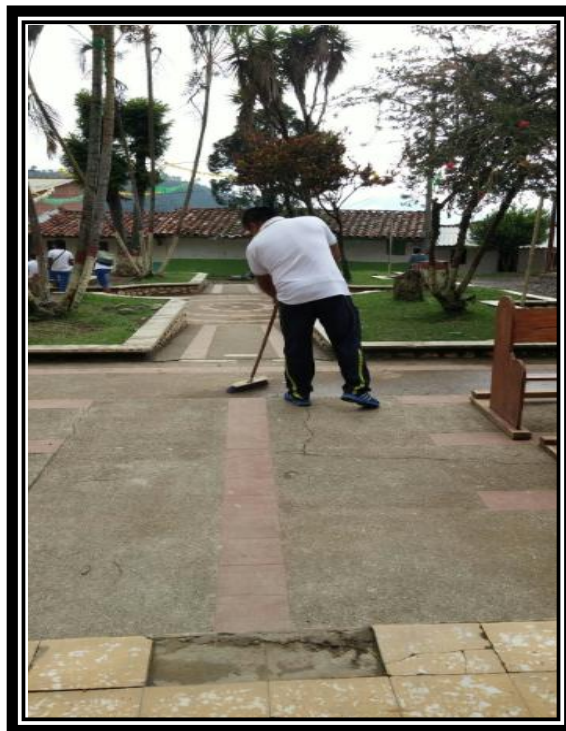
Imagen 12 prácticas culturales