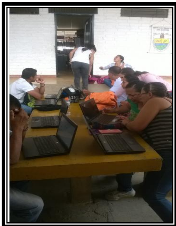
Imagen 18 Aplicación cuestionario modelo pedagógico