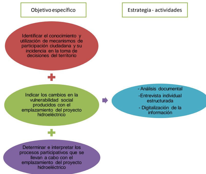
Ilustración 2 Relación objetivos específicos y metodología

Para dar cumplimiento al objetivo propuesto se determinaron las siguientes actividades y estrategias, las cuales constituyen el input para el análisis investigativo, tanto de orden secundario como primario, éste último basado en el diseño y aplicación de entrevista individual estructurada como técnica de recolección de información: