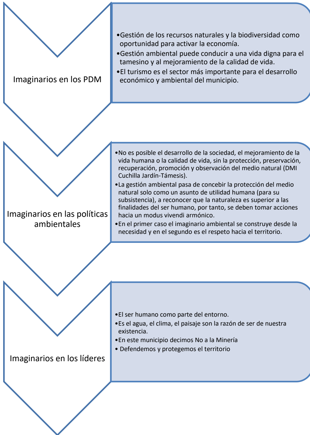
Figura 1 Aproximación a los imaginarios ambientales