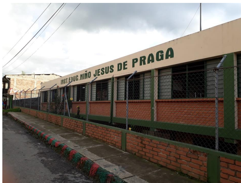
Imagen 1. Fachada Institución Educativa Niño Jesús de Praga

En el contexto de la Institución Educativa Niño Jesús de Praga los conflictos se originan esencialmente en las dinámicas de interrelación entre estudiantes, y también entre estudiantes-docentes, las situaciones de convivencia difícil en la institución se presentan en las aulas de clase y los espacios de descanso, lo cual se presenta de manera cotidiana, debido principalmente al no seguimiento de normas, recomendaciones, directrices básicas, espacios reducidos para la recreación, falta de acompañamiento por parte de los padres de familia y algunos docentes.