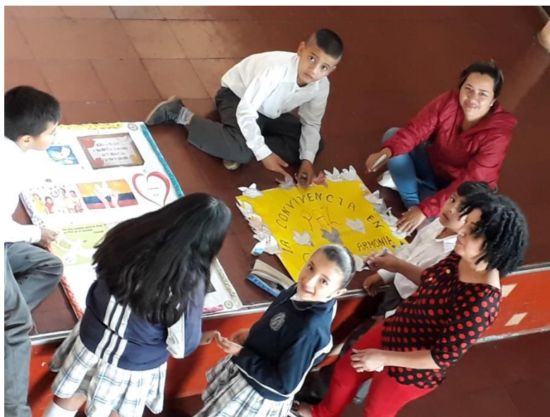
Imagen 4. Actividad palomita de paz

Los educandos se reconocen además por las características físicas o contextuales, dando lugar a una relación de éstas con sus actitudes, lo que en algunos casos implica enfrentamientos. Al respecto, un estudiante plantea: “Batalla como es negrito siempre está “pegiando” y Chávez porque le dicen apodos como Chavela también” EST05/R58/ENT5. ). Según Skliar (2002) “no debe clasificarse a los sujetos reconociendo que su esencia es particular y ello es lo que ayuda a construir identidad, proyectando de esta manera particularidades y su visión del mundo”. Es así, como estas diferencias, antes de convertirse en una forma para incentivar los conflictos, deben aprovecharse para aportar, contribuir y crear de manera colectiva, reconociendo que aquello que hace diferente al otro puede aportar al desarrollo personal y social.