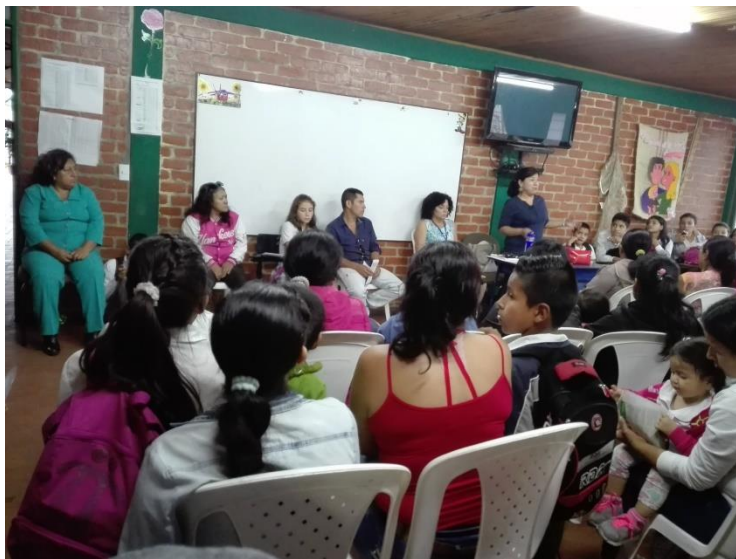
Imagen 3. Reunión de padres de familia