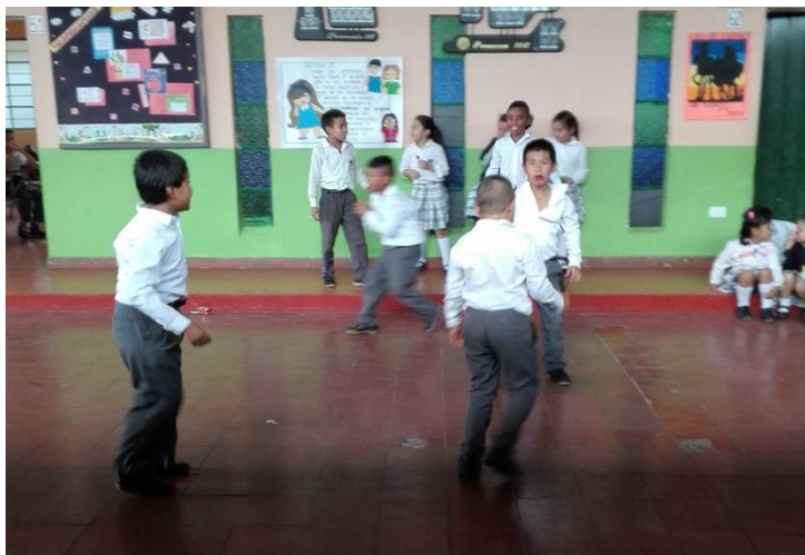
Imagen 5. Actividad conflictos al teatro