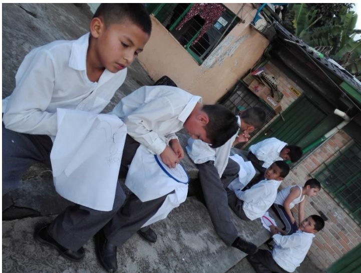
Imagen 3. Estudiantes de cuarto grado en actividad de tejido