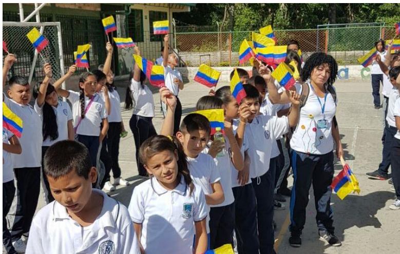
Imagen 6. Actividad el mundialito

disputa un juego al interior de la cancha, algunos jugadores de otros equipos practican las jugadas en el patio interior, lo que en dos ocasiones originó daños en la infraestructura de la institución debido al manejo inadecuado del balón, al preguntar acerca de quién o quiénes eran los responsables, ningún estudiante respondió, debido a que inicialmente son amigos, por lo cual encubren la falta, esto lo hacen para evitar el posible castigo o llamado de atención.