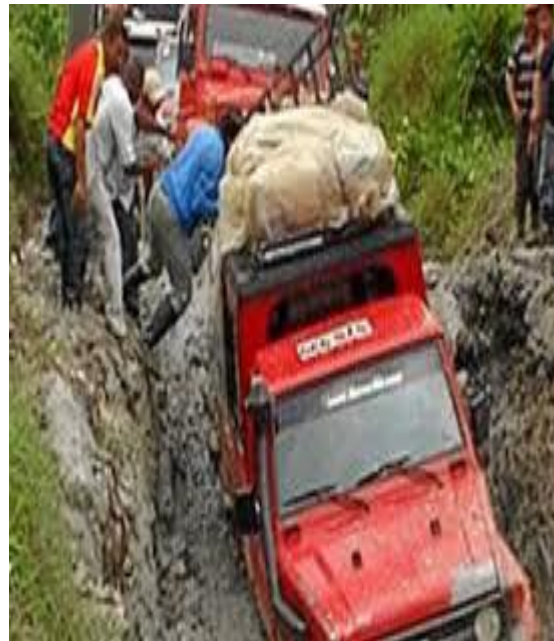
Vía Junín - Barbacoas

en el Gobierno del presidente Álvaro Uribe Vélez en el año 2009, se realizaron algunas reclamaciones dentro del Municipio, con las cuales se invitaba al mandatario de turno a reclamar por un derecho sentido de todos los Barbacoanos como es la vía Junín-Barbacoas, logrando que se asignaran cuarenta mil millones de