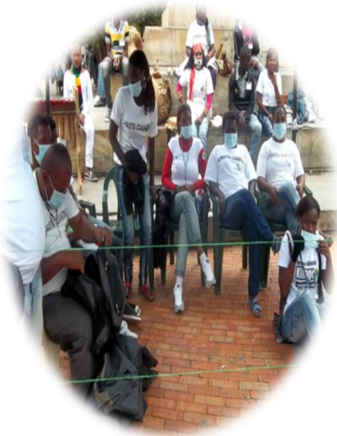
Huelga de hambre, día de la mujer, 2012