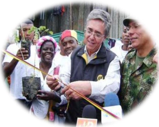
Corte de cinta del Ministro de transporte, por inicio de trabajos en la vía, 2011.

Se realizó una concentración en el parque Tomas Cipriano de Mosquera, donde se organizó un programa cultural, mostrando las principales manifestaciones folclóricas del Municipio, como danzas, teatro, canciones, coplas, versos, loas, revista gimnástica, entre otras. También hubo acompañamiento de diferentes medios de comunicación, entre los que se encontraba el noticiero CNN quien difundió la noticia en todo el País.