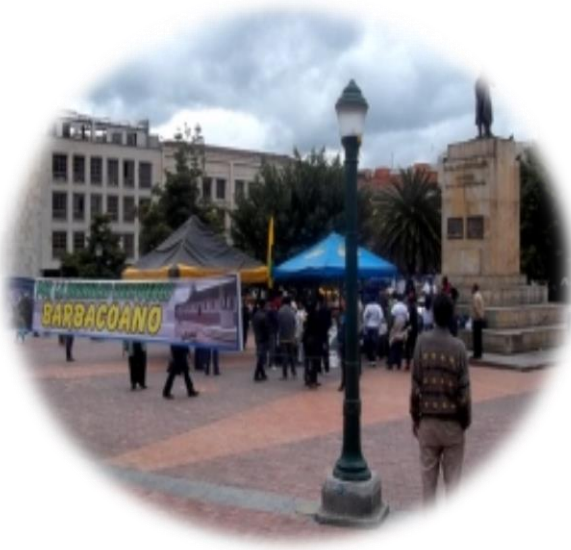
Huelga de hambre, víspera del día de la mujer, San Juan de Pasto 2012

Motivados por este hecho el Movimiento de Piernas Cruzadas se desplazó a la ciudad de Pasto (Nariño) para mantener una huelga de hambre que durara hasta el día 8 de marzo que se conmemora el día Internacional de la mujer. Este día se celebra la lucha histórica de las mujeres, quienes enfrentaron los desafíos y la generación de cambios en la humanidad. “Todo comienza el 8 de marzo de 1857, cuando decenas de obreras textiles del Bajo Manhattan (Nueva York) se declararon en huelga y se lanzaron a las calles en protesta por las miserables condiciones de trabajo, ellas exigían la humanización de las condiciones de trabajo e igualdad de condiciones”.(Martínez, 2008, 1).