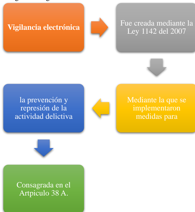
Gráfico 2: Marco legal del Vigilancia Electrónica.