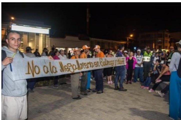
Diego, J. 2016. Movilización con población de Villamaria (Caldas). [Fotografías] Trabajo de grado conflicto socio ambiental entorno a la Mina Tolda Fría Universidad de Manizales.