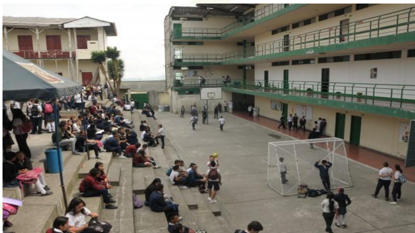
Imagen 7. Comuna San José. Instituciones educativas de la comuna.

aprendizaje y enseñanza en valores como la moral, generosidad, la comprensión y la responsabilidad y desde ellos llegar a concientizar las diferentes problemáticas ambientales.