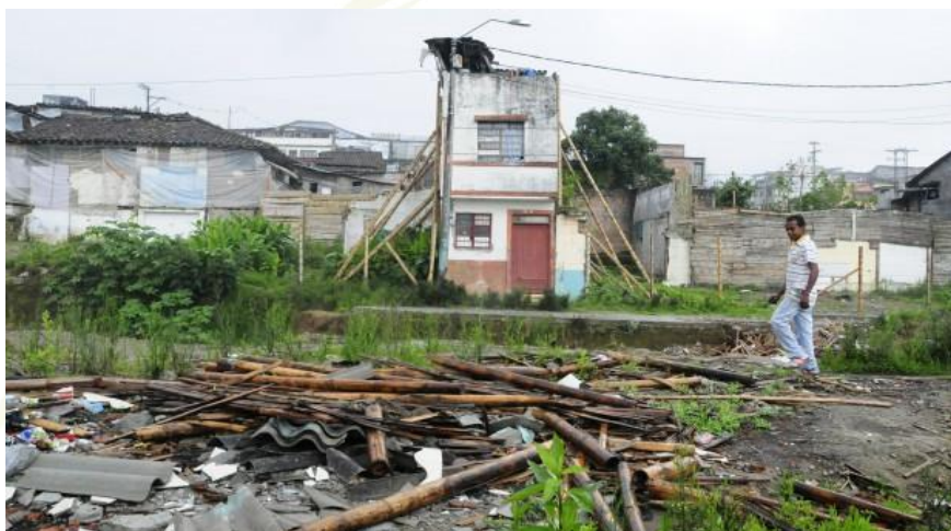
Imagen 3. Comuna San José, escombros y demoliciones.

Se concluye que todas las acciones negativas en dichas obras son la falta de planeación de estrategias como lo infiere Hilda (2005), que es el punto donde la comunidad no tiene conocimiento de lo que está pasando al interior de dichas obras y los aspectos reglamentarios como se están desarrollando.