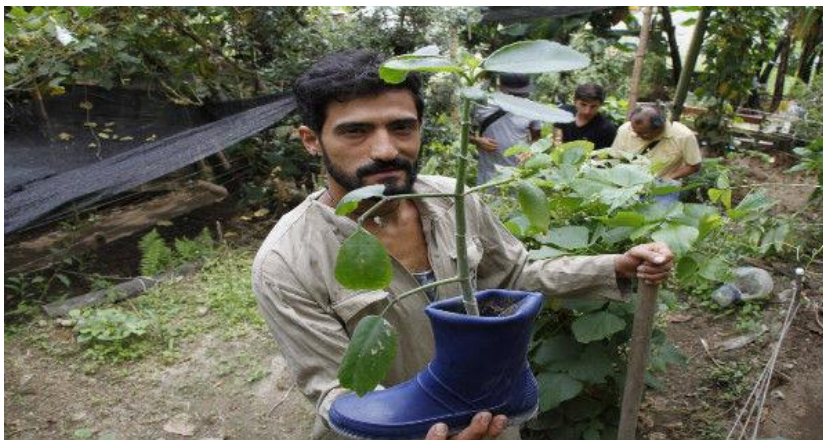
Imagen10. Comuna San José. Semillero de huertas comunativa.

Estas actividades que planea Comunitativa, fue iniciativa de su director como una salida y sostenimiento de acuerdo con lo que estaba sucediendo a la comuna con las reubicaciones y el macro proyecto, como revelación y protección de los habitantes, generando que tuvieran otras alternativas educativas y a custodiar a los integrantes del barrio y amortiguar el daño ambiental por escombros y residuos y mala planificación que ha generado el macro proyecto.