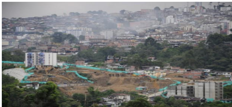
Imagen5. Comuna San José. Obras de reubicación adelantadas.

En la imagen 5 podemos visualizar el estado actual de las obras, como se concluye el proceso de las construcciones de los apartamentos y las labores de infraestructura como puentes, calles y avenidas, a simple vista se observa una construcción irregular.