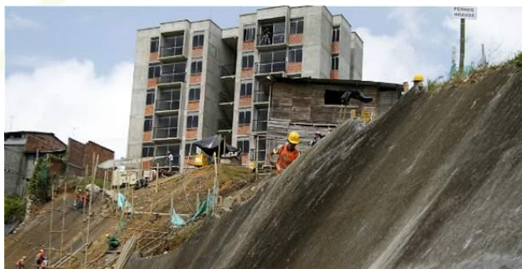
Imagen 4. Comuna San José, apartamentos para la reubicación de la comuna.

Lo anterior ha llevado a una gran contaminación visual y atmosférica que han contribuido a generar brotes y problemas de salud, y el caos que ocasiona al ingresar y salir del barrio. Los espacios que se han generado entre demoliciones también han generado inconvenientes de residuos y mal manejo de basuras.