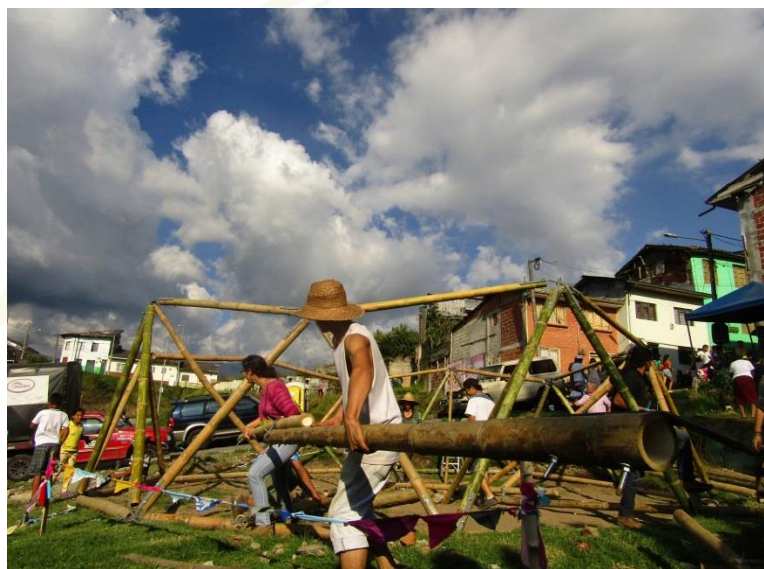
Imagen 2. Comuna San José, huertas fundación comunicativa.

Lo anterior muestra que la forma más coherente de afrontar los daños generados por el Macro Proyecto es través de las estrategias didáctico-pedagógicas, tales como: las huertas y los semilleros, en los que se orienta una enseñanza básica en torno al cuidado de los terrenos baldíos, para usarlos en bien de la comunidad.