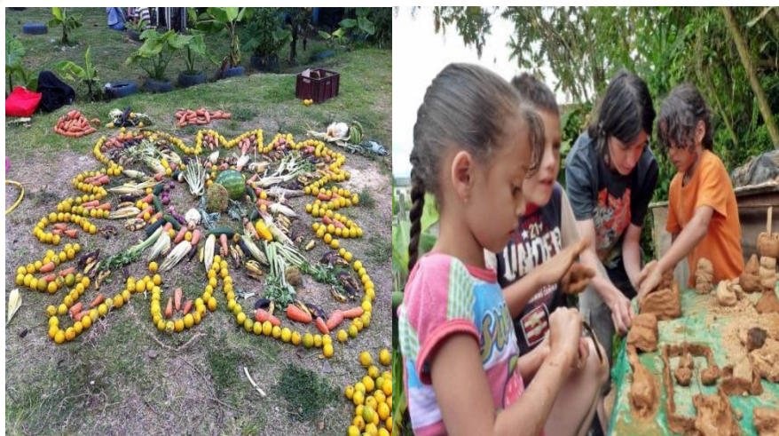
Imagen 9. Comuna San José. Semillero de huertas comunitaria.

El desarrollo de huertas se constituye en una práctica muy importante para la gente de la comunidad para dejar a un lado las tareas desarrolladas en las obras y las problemáticas que han ocasionado las construcciones para entrar a trabajar desde los semilleros que trabajan el manejo de huertas, talleres ecológicos y actividades lúdicas con la población más vulnerable.