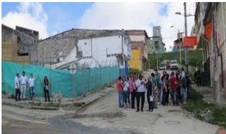
Imagen 6. Comuna San José. Líderes y presidentes comunales.

La comunidad se ha pronunciado su acuerdo sobre como pueden hacer para afrontar los daños ambientales generados por el macro proyecto de la siguiente manera: principalmente enfatizar en la unión de la comunidad, y después sería la identificación de los daños ocasionados por el Macro Proyecto, para obtener ayuda de las instituciones. La población dice que es poco lo que ellos pueden hacer, que todo está en las manos de las instituciones que trabajan en el proyecto como las instituciones de carácter social que entran a cumplir un papel en la comuna.