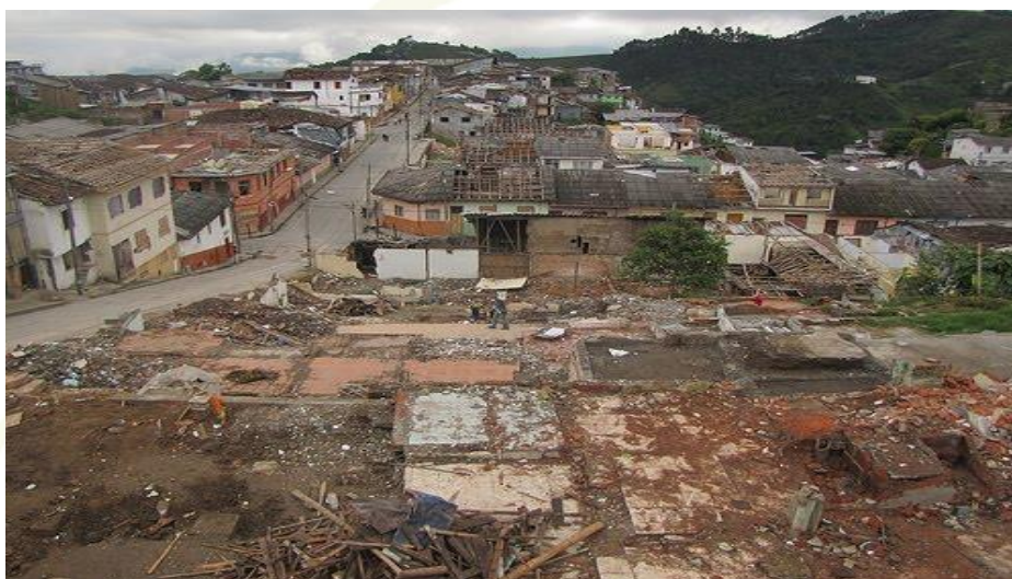
Imagen 1. Comuna San José demoliciones inconclusas.

pensar en las consecuencias ambientales tan notorias que están dejando a la comunidad. Este vacío en la inadecuada planeación de las demoliciones por parte de las instituciones involucradas es confirmado por los informantes de la comuna, debido a que se dejan espacios entre las casas, los que se tornan en escondites para la delincuencia común, tal es el caso de los raptos después de cometer sus robos.