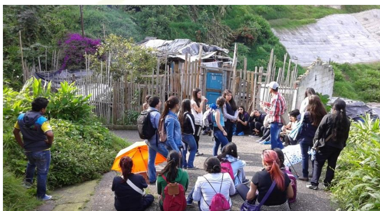
Imagen 8. Comuna San José. Salidas de campo y actividades pedagógicas.

afectivas que el estudiante lleva a cabo para aprender, con las cuales puede planificar y organizar actividades de aprendizaje. Las estrategias de enseñanza pueden ser utilizadas y construidas por profesores y ser llevadas al trabajo de campo haciendo énfasis en habilidades de enseñanza para los estudiantes y fomentando habilidades de aprendizaje. Sector la autora Parra (2003).