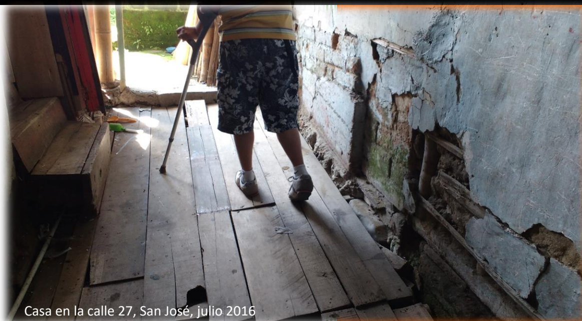
Casa en la calle 27, San José, julio 2016