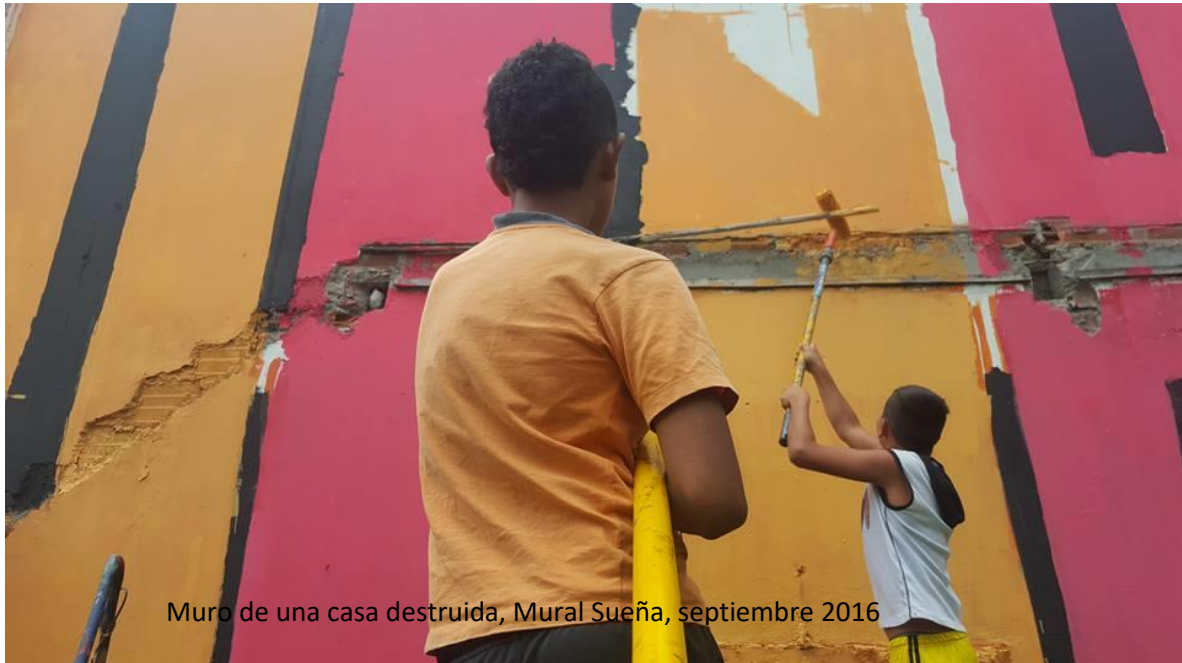
Muro de una casa destruida, Mural Sueña, septiembre 2016