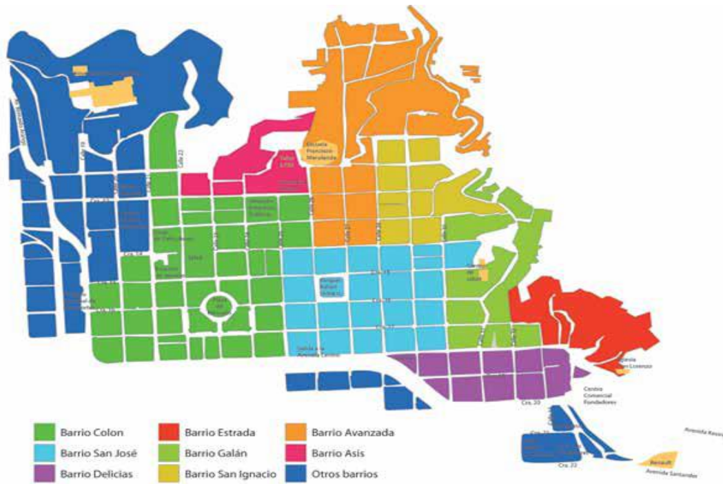
Figura 1: Mapa Barrios Comuna San José.