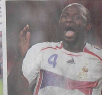
Vieira, la máquina en el medio campo francés. También ha marcado goles decisivos.