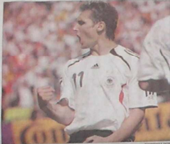
Klose, goles seguros para Alemania. Lleva cuatro y es el goleador del certamen.