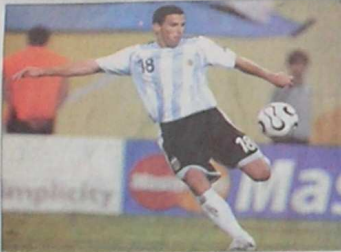
Maxi Rodríguez. Ya marcó uno de los mejores goles del mundial frente a México en octavos.

Klose, Maxi Rodríguez, Buffon, Shevchenko, Beckham, Maniche, Ronaldo y Vieira han sido las figuras más destacadas de sus equipos en lo que va del mundial. Brillan.