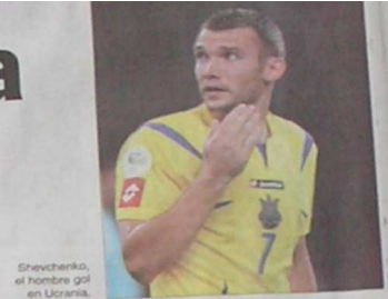
Shevchenko, el hombre gol en Ucrania.