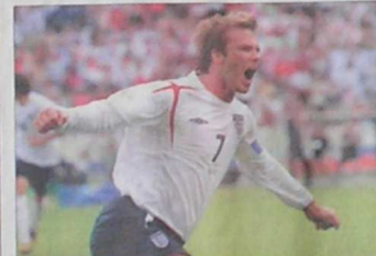
Un centro o un tiro libre de Beckham pone a temblar a los arqueros.