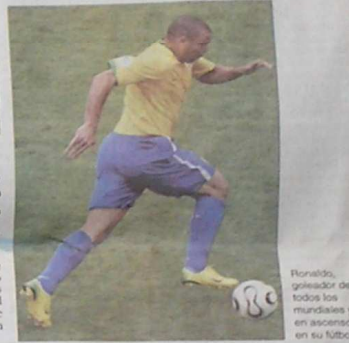
Ronaldo, goleador de todos los mundiales y en ascenso en su fútbol.