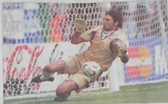
Las atajadas de Buffon tienen a Italia en cuartos de final.

Klose, Maxi Rodríguez, Buffon, Shevchenko, Beckham, Maniche, Ronaldo y Vieira han sido las figuras más destacadas de sus equipos en lo que va del mundial. Brillan.