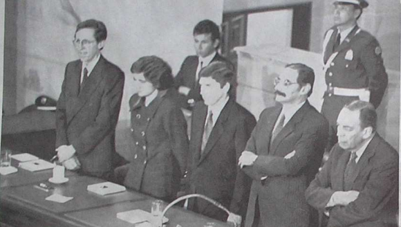
Antonio Navarro, Horacio Serna y Álvaro Gómez Hurtado (q.e.d.) fueron los presidentes de la Constituyente, durante el gobierno del mandatario César Gaviria Trujillo. Esta imagen muestra la instalación de la Asamblea Nacional Constituyente, en el Centro de Convenciones Gonzalo Jiménez de Quesada, en Bogotá.

Mientras en la Carta Política anterior no existía prácticamente ningún mecanismo para la protección de las garantías fundamentales que en otras latitudes ya habían alcanzado un alto grado de desarrollo. Veintidós reformas ha sufrido la Carta desde que nació, el 4 de julio de 1991.