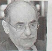
Horacio Serpa Uribe.

Judicatura, pues la idea era crear una especie de "Gerencia" para la Rama Judicial. Pero el mayor aporte del ex Designado conservador fue la creación de la Fiscalía General de la Nación, organismo adscrito a la Rama Judicial, pero con autonomía presupuestal y administrativa, que reemplazó las funciones de los juzgados de instrucción criminal.