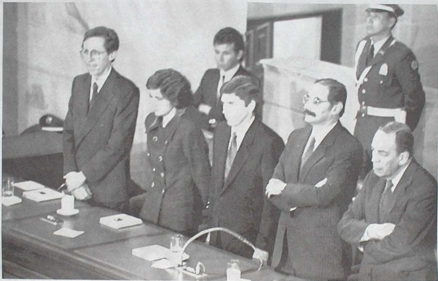
Antonio Navarro, Horacio Serpa y Álvaro Gómez Hurtado (q.e.p.d.) fueron los presidentes de la Constituyente, durante el gobierno del mandatario César Gaviria Trujillo. Esta imagen muestra la instalación de la Asamblea Nacional Constituyente, en el Centro de Convenciones Gonzalo Jiménez de Quesada, en Bogotá.

Mientras en la Carta Política anterior no existía prácticamente ningún mecanismo para la protección de las carencias más apremiantes del ciudadano común, la nueva introdujo todo un conjunto de derechos fundamentales que en otras latitudes ya habían alcanzado un alto grado de desarrollo. Veintidós reformas ha sufrido la Carta desde que nació, el 4 de julio de 1991.