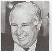
Misael Pastrana Borrero.