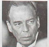
Álvaro Gómez Hurtado

En la Constituyente, Gómez formó parte de la Comisión de Justicia que se encargó de proyectar reformas como la creación del Consejo Superior de la