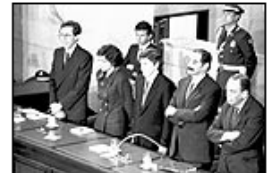
Antonio Navarro, Horacio Serpa y Álvaro Gómez Hurtado (q.e.p.d.) fueron los presidentes de la Constituyente, durante el gobierno del mandatario César Gaviria Trujillo. Esta imagen muestra la instalación de la Asamblea Nacional Constituyente, en el Centro de Convenciones Gonzalo Jiménez de Quesada, en Bogotá.