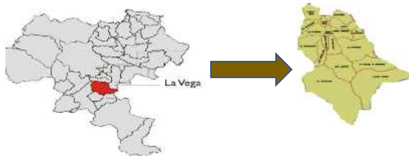
Figura 1. Localización del Municipio de La Vega en el mapa del Departamento del Cauca – Plan de Desarrollo 2012 – 2015

Colombia se divide en 32 departamentos y el distrito capital Santafé de Bogotá. Entre estos departamentos se ubica el Cauca, que a su vez se subdivide en 42 municipios. Uno de ellos es La Vega, conformado por zona rural y urbana. Entre los cuales se cuentan 13 corregimientos en total. Uno de estos corregimientos es San Miguel, ubicado geográficamente en el norte del municipio de La Vega, a 86 kilómetros al suroriente de la capital caucana y a 23 kilómetros de la cabecera del municipio. (Alcaldía Municipal de la Vega Cauca, 2012, p. 13)