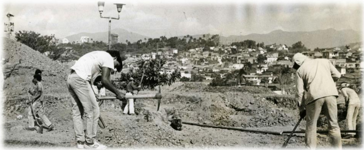
Foto 7. Remoción de tierras para la construcción del parque.