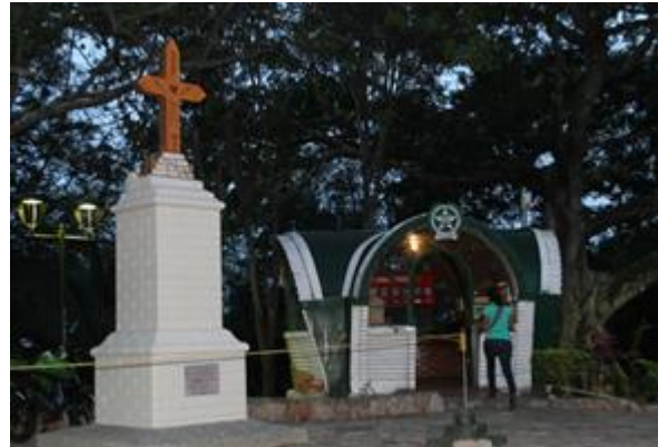
Foto 5. Loma de la Cruz

Tomada el 27 de julio/13