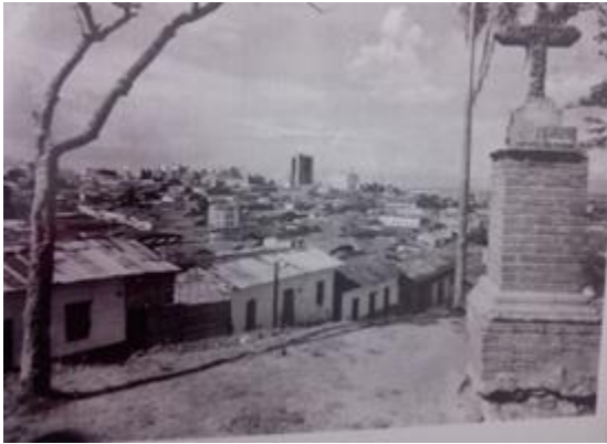
Foto 4. Sector la loma

con materiales de cemento, ladrillo, mejoraron las fachadas y se instaló el puesto de policía (Ver Fotos 4 y 5).