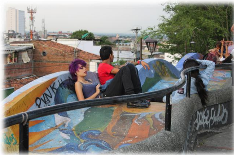
Foto 10. Actores de la tarde

Fuente: MMC. Foto en Póster. Exposición Fotográfica, Parque de los afectos. Manizales, Cali, 2014.