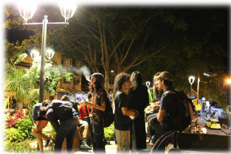
Foto 3. En la noche-siendo.

Fuente: MMC. Exposición Fotográfica, Parque de los afectos. Manizales, Cali, 2014.