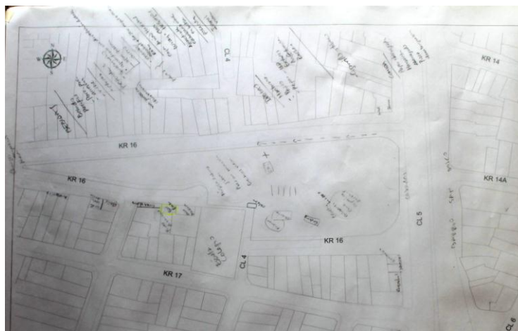
Figura 4. Cartografía socio-cultural, Sitios de consumo