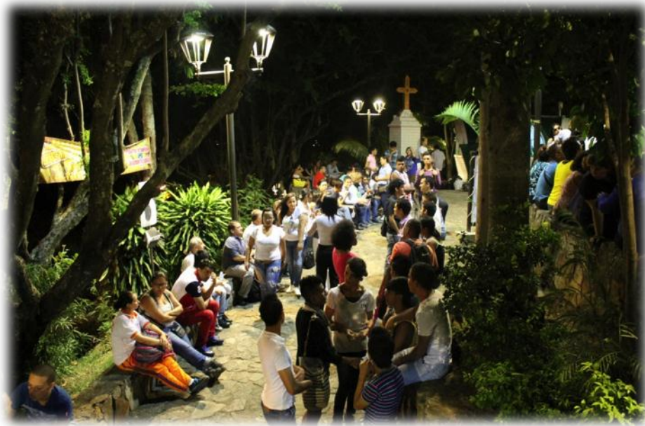
Foto 14. Cruz-hados.

Fuente: MMC. Exposición Fotográfica, Parque de los afectos. Manizales, Cali, 2014.