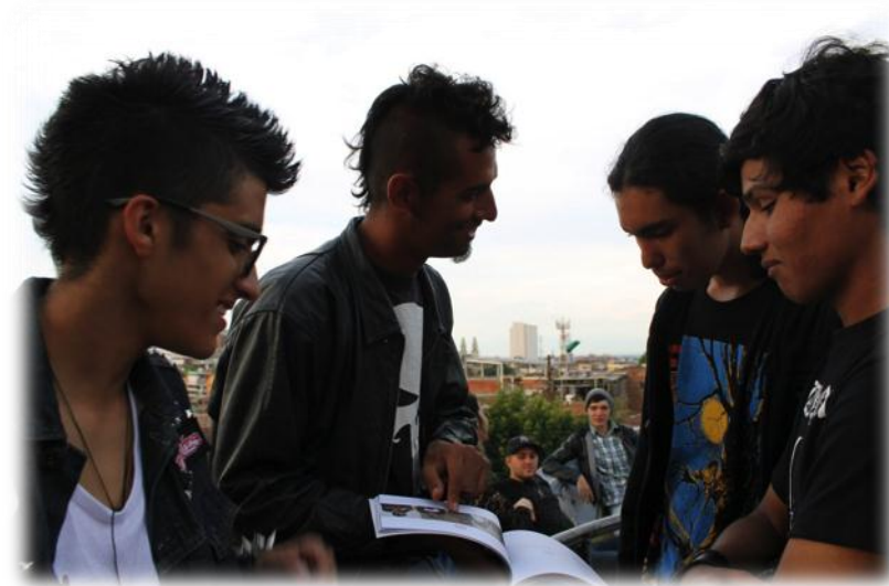
Foto 6. Viéndonos, reconociéndonos

Parque Artesanal Loma de la Cruz, Cali, 2015. F: 5, V: 1/60, ISO: 100 Tomada el 18 de abril de 2015 Hora: 5:44 pm.