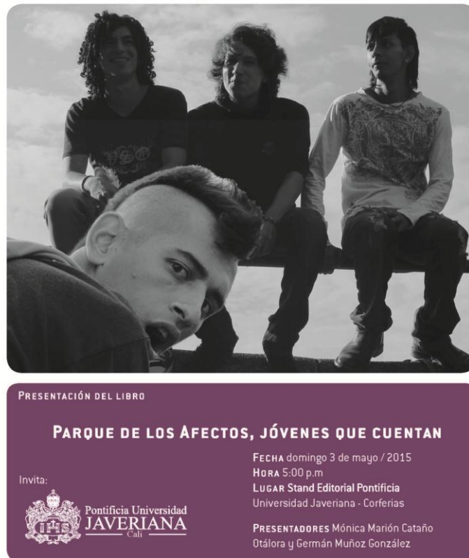
Figura 5. Flyer para presentación del libro Parque de los Afectos en FILBO