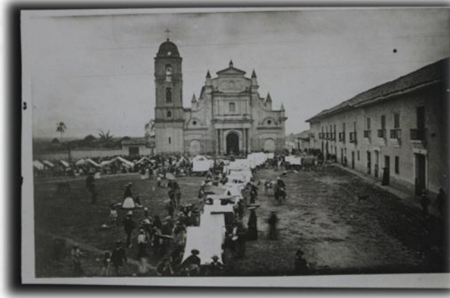
Foto 11. Plaza Caycedo y Cuero y Catedral de San Pedro