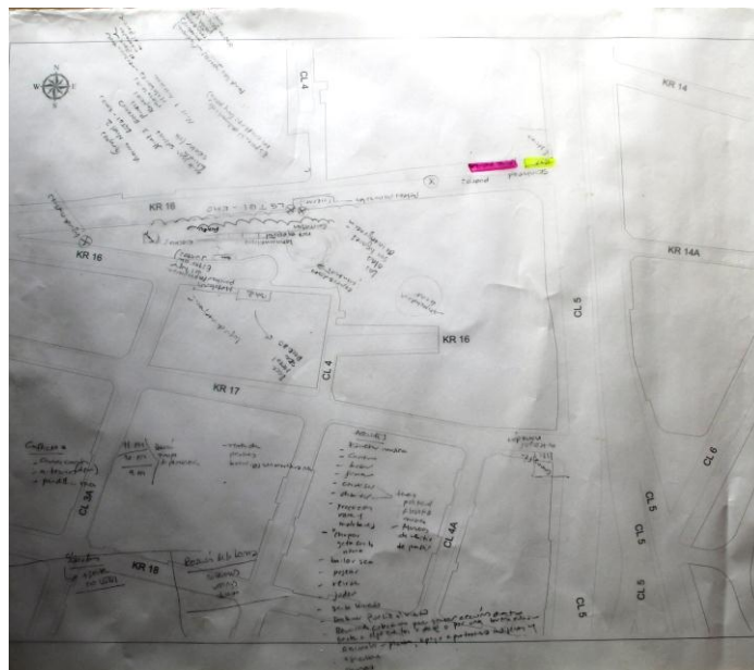
Figura 3. Cartografía socio-cultural - Acciones