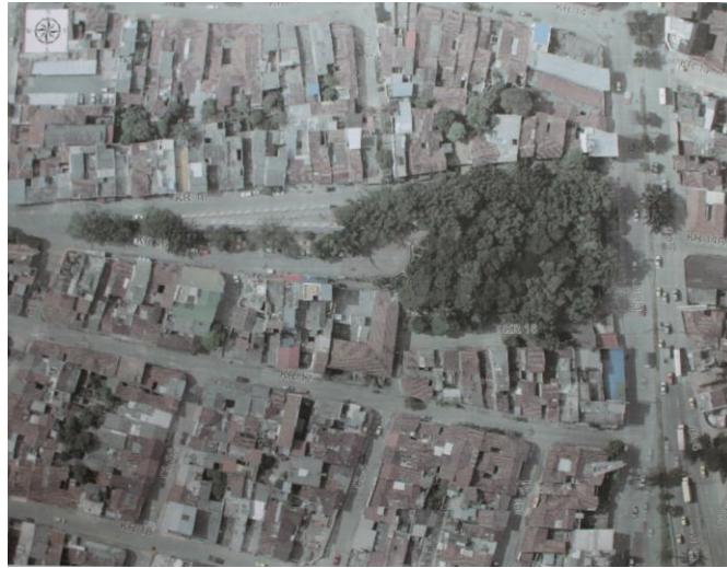
Figura 2. Plano - Planta del parque y sus alrededores