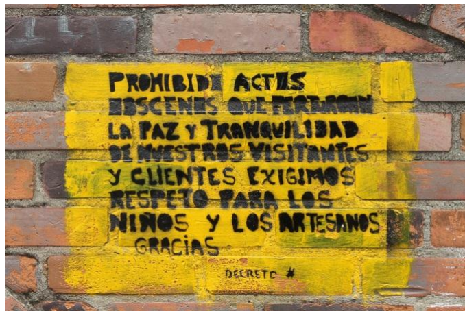
Foto 15. Pro-inhibiciones.

Frente a situaciones como la diversidad sexual y expresiones afectivas entre jóvenes de la comunidad LGTBI, los artesanos han tenido iniciativas individuales que pasan por medidas represivas centradas en la cristiandad, como exorcizar el área del parque habitada por la comunidad con rezos y conjuros, proponer la construcción de otro lugar para ellos y poner avisos como el que se aprecia en la siguiente fotografía: