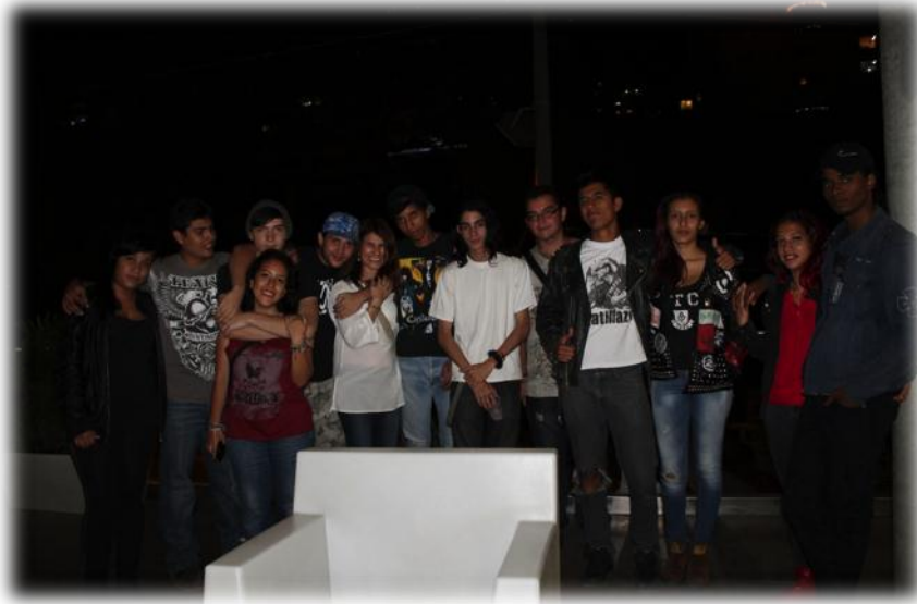
Foto 16. De celebración