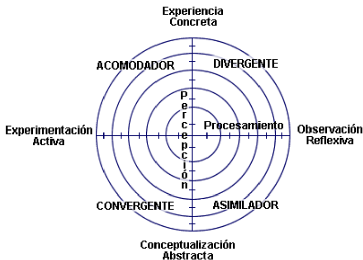
Ilustración 1: Estilos de aprendizaje

Kolb planteaba que existen dos tipos de percepción: la experiencia concreta y la conceptualización abstracta (y generalizaciones); a medida que se iba adentrando en las investigaciones de ambos tipos de percepción, descubría ejemplos de ambos extremos; algunos procesan la información a través de experiencia activa mientras que otros a través de la observación reflexiva. Después de reflexionar acerca de lo descubierto planteó un modelo que dividió en 4 cuadrantes de esta forma: