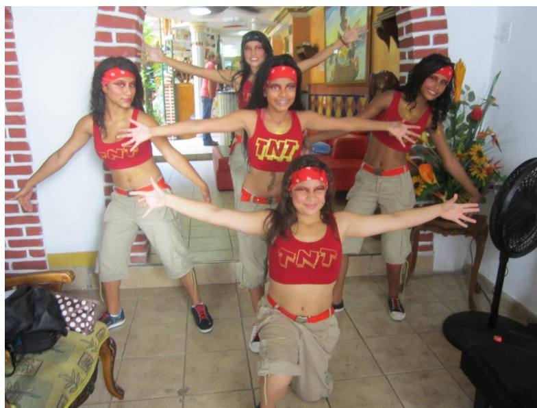
Ilustración 3. Performance de grupo TNT

“El rol de la mujer es muy participativo. Proponemos ideas, proyectos, asumimos liderazgos. Propusimos el tema de la época navideña y los hombres se inclinan más hacia lo ambiental” (integrante de Tierra Joven).