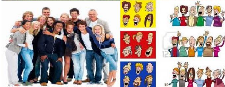
Lo que necesitamos que sea la ciudad.

Muchas veces pensamos que nuestra ciudad necesita muchos cambios en cuanto a mega construcciones y todo eso pero nunca pensamos en que una buena ciudad es aquella en donde nos podemos sentirnos cómodos y en donde podamos vivir y convivir felizmente.