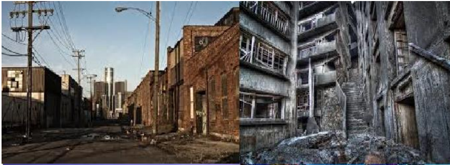
Lo que pensamos que es la ciudad.