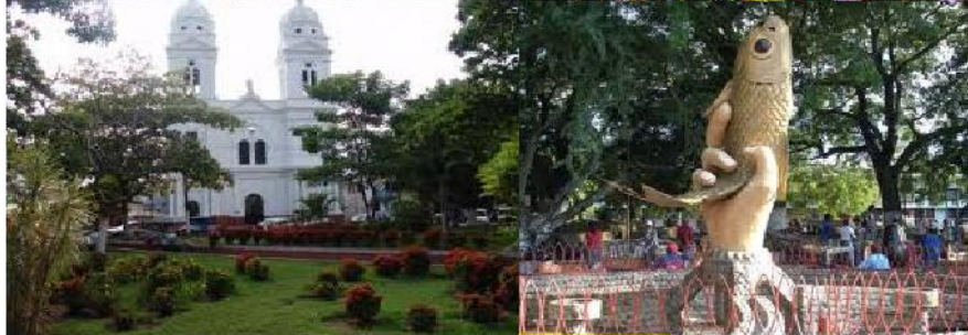
Lo que realmente es la ciudad.