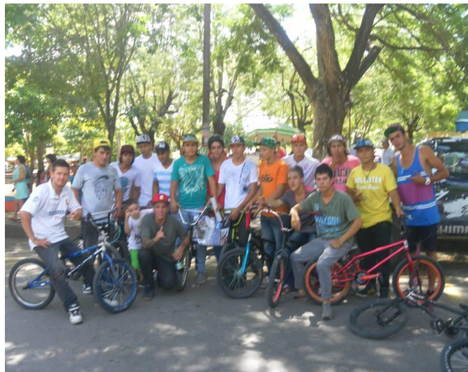
Ilustración 5. Colectivo BMX La Dorada