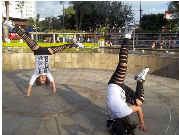
Ilustración 2. Performance de grupo TNT

La aparición de lideresas jóvenes en la escena política y/o esfera pública constituyen contadas excepciones que “confirman la regla” del imaginario social sobre el rol de las mujeres culturalmente relegadas a la esfera privada. Aguilera también destaca que en las nuevas generaciones hay una tendencia creciente a cambiar esa situación, cambio provocado por las propias mujeres.