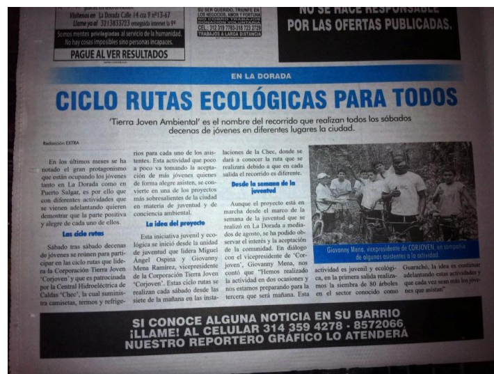
Ilustración 6. Artículo en el periódico regional sobre actividad del grupo Tierra Joven.

Cuando Aguilera (2010) se refiere a las expresividades y políticas de visibilidad de las/los jóvenes que se agrupan en un colectivo para hacer algo, está haciendo alusión a las estrategias, lenguajes y manifestaciones que ellos utilizan y que están ligadas a sus características culturales. Aguilera analiza el hecho de que los y las jóvenes tienen que crear estas estrategias de comunicación para visibilizarse porque se les niega como actores sociales y no tienen una voz propia, ya que siempre son otros los que hablan por la juventud a través de los medios .