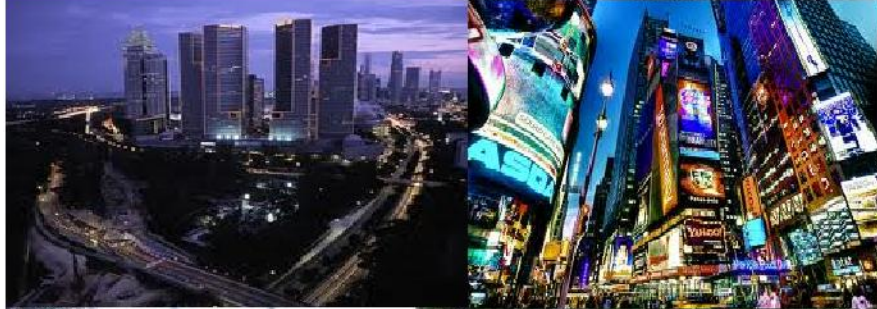
Lo que queremos que sea la ciudad.