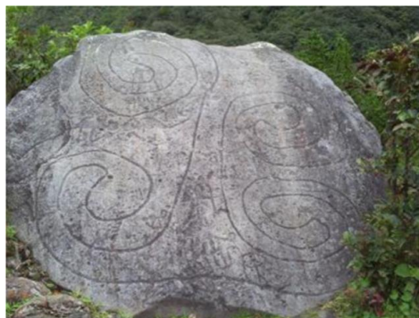
Figura 6. Petroglifo Piedrancha-vereda Pueblo Viejo 14 .

Los dibujos en forma de dos V unidas por el vértice o formando un 8 simbolizan al hombre, en el Sol de los Pastos habla de las diferentes edades del hombre, de los diferentes estados. El ombligo representa (si estaba resaltado) a la zona central de un plato, también significaba el 4; en cambio sí estaba representado por el falo o un punto o raya significaba la unidad, el poder de creación.