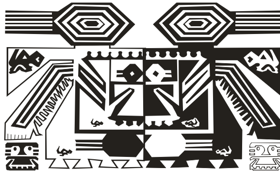
La dualidad 10

El Runa o ser humano es un ser dualístico, por ello en el tejido, guanga y runa es un todo, dentro del mundo mágico y espiritual, acompañado de la música y la danza en el tiempo y el espacio como se observa en la siguiente imagen.