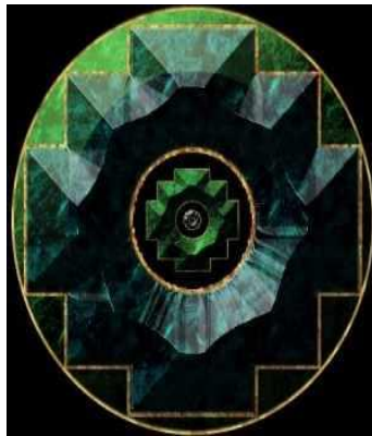
Figura 9. El tejido y el color determinación de jerarquía y rango social 17 .

Dentro del pensamiento dual los colores tienen representaciones míticas así: el color negro es lo femenino, que representa la tierra el abajo; el color blanco es lo masculino que representa el aire, el arriba. De igual manera los tejidos andinos se teñían con una gran gama de colorantes naturales para que el poder mágico de la pachamama proporcionara su energía y vitalidad. Como lo indica la figura.