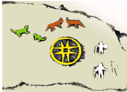
Figura 5. Petroglifo de los Machines 13 .

El investigador Harold Santacruz (2009, 12) realiza los siguientes aportes: las quebradas o riachuelos, las representan por pequeños círculos unidos a una línea de flujo que muchas veces desaparece —similar al esquema que se utiliza para el espermatozoide-. Estas nacientes se encuentran siempre en la posición geográfica que corresponde a las partes altas de las cordilleras, depresiones y acantilados. Las espirales representan la energía. Si los espirales se encuentran en diagramas que representan cuerpos costeros, indican el potencial de mareas o del oleaje, que proporciona la energía para adentrarse aguas arriba navegación restringida. Si el espiral se encuentra sobre un petroglifo en una isla, indica el potencial hidrodinámico del oleaje que ocasiona el arrastre hacia una dirección privilegiada. Si el espiral está unido a otro más pequeño, puede referirse a la diferencia en la observación de los cuerpos celestes.