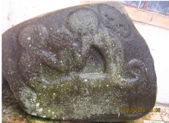
Petroglifo Sapuyes. 15

Puede ser el mensaje de un chamán como lo supone Field (1974), pueden ser símbolos de clanes o de tótems para repetirlos gráficamente sobre el cuerpo de las personas a fin de que se puedan distinguir entre sí o para poderlos portar en las diferentes vestimentas. No tenemos elementos suficientes que nos permitan apoyar con preferencia la una o la otra hipótesis.