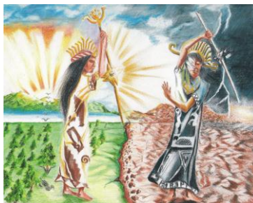
Figura 1. El mito de las perdices 5

En la apuesta, se dice que ganó la perdiz negra, por eso la riqueza y el saber quedaron para abajo, para adentro, para Barbacoas, y la pobreza para la provincia, la sierra, el afuera. Otros dicen que ganó la blanca por lo cual quedó encima, arriba, con todas sus cualidades, que mató a la negra, o la petrificó convirtiéndola en piedra, en cerro: el Gualcalá, en general, no se enfatiza si ganó la una o la otra, sino la posición en que quedaron: quién quedó en posición o mirando para allá y quién quedó en posición o mirando para acá; puesto que cada una representaba o traía consigo la mitad del mundo y de las cosas. La representación del mito de las perdices puede ser observada en la Figura 1.