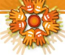
Cuadro 1. Unidad de trabajo