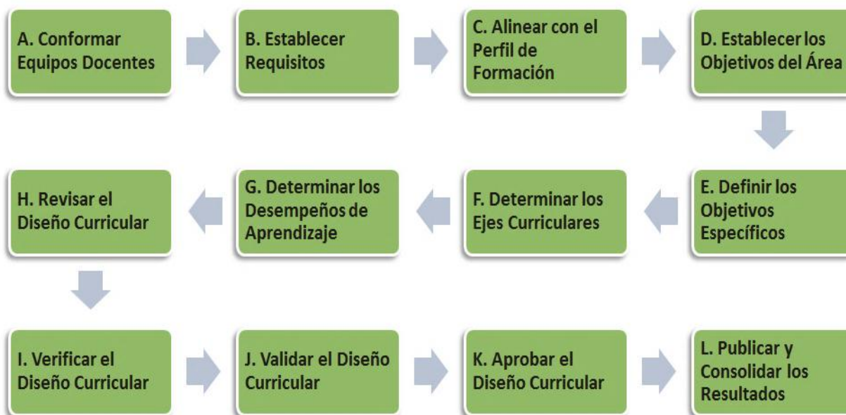
Figura 1. Etapas para dinamizar el proceso de diseño curricular