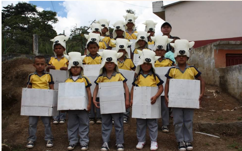
Figura 7. Aprendiendo en la escuela en el día del idioma

El objetivo central de la escuela es promover y conseguir el aprendizaje de sus alumnos, éstos van a la escuela para aprender; en consecuencia, cuántos más alumnos aprendan en esta escuela, mayor calidad tendrá; a su vez, cuánto más aprendan todos y cada uno de estos alumnos, más eficaz será. Muntaner (2000, p. 79)