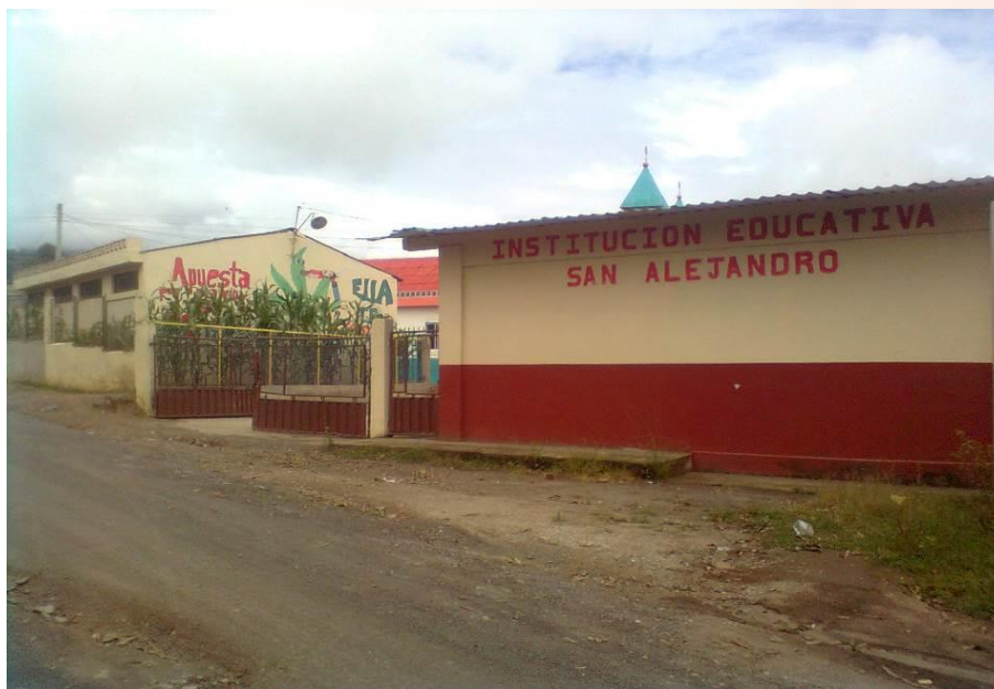
Figura 3. Institución Educativa San Alejandro