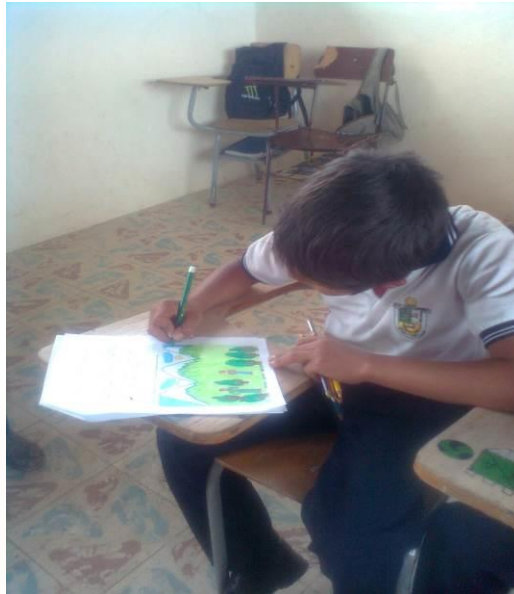
Figura 11. En un taller de dibujo libre

El juego no es sólo juego infantil. Jugar, para el niño y para el adulto... es una forma de utilizar la mente e, incluso mejor, una actitud sobre cómo utilizar la mente. Es un marco en el que poner a prueba las cosas, un invernadero en el que poder combinar pensamiento, lenguaje y fantasía. (Bruner, 1984)