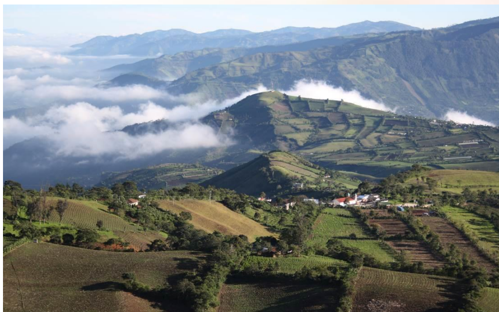
Figura 2. Vereda San Alejandro. Institución Educativa San Alejandro