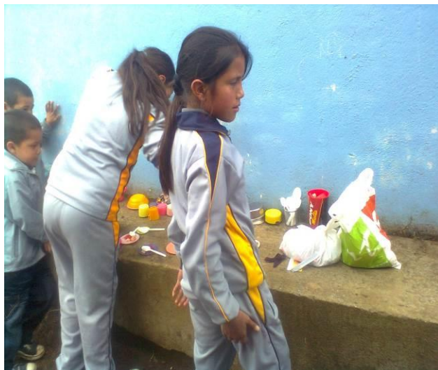
Figura 5. Niñas de tercero y cuarto compartiendo sus alimentos con niños de preescolar y primero

En consecuencia a lo mencionado anteriormente Gimeno (2002) habla de la igualdad desde el modo de entender que los seres humanos son diversos entre sí porque conservan cada uno sus propios rasgos, intereses, gustos, capacidades, creencias, hábitos, valores más allá de la igualdad en cuanto a su naturaleza de ser humanos, entonces lo fundamental es convivir con esas diferencias, respetándonos.