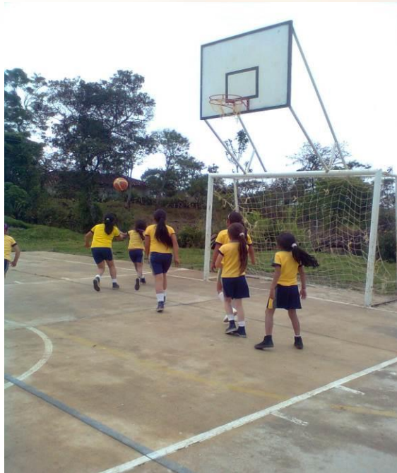
Figura 9. Niñas de tercero y cuarto jugando baloncesto con niñas de otros grados

Las niñas juegan baloncesto con equipos integrados por niñas de tercer, cuarto y quinto, no importa el calor que está haciendo y que estén con el uniforme de diario, quieren divertirse. Porque su intención es compartir, aprender, no importa sin las integrantes del juego son de diferentes grados, si pueden o no jugar bien, no importa si son grandes o chicas, lo verdaderamente importante es compartir con respeto las cualidades que cada una de ellas tiene, destrezas que se demuestran en los equipos que cada una conforma. (Observador Gd: DC)