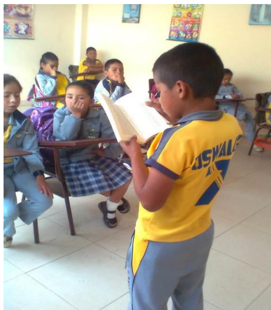
Figura 6. El respeto promueve una sana convivencia

López Melero propone que la cultura de la diversidad es quien debe cambiar sus comportamientos y actitudes para que las personas no se vean sometidas a la discriminación sino al contrario se sientan respetadas dentro de una convivencia pacífica.