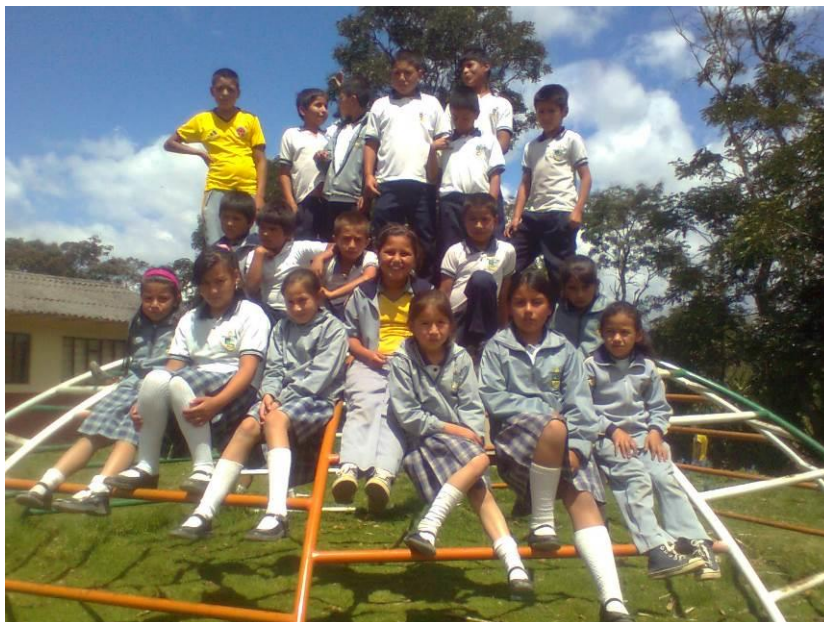
Figura 4. Grupo de tercero y cuarto

Para seguir el debido proceso en el desarrollo de la investigación se informó con antelación al señor Rector de la institución sobre el objetivo que se pretendía desarrollar, solicitando la respectiva autorización a través de un oficio de apoyo y consentimiento, de igual manera se pidió a los padres de familia de los estudiantes menores de edad seleccionados para la unidad de trabajo firmar un consentimiento informado, a partir del cual se permitió al grupo investigador realizar los registros fotográficos, videos, entrevistas, talleres y demás actividades planeadas necesarias para el desarrollo del proceso.