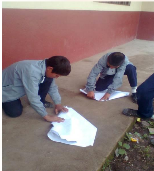
Figura 8. Jugar es divertido

“En la relación de juego surgida entre el Patito Feo y los cisnes se presenta una relación de respeto porque se quieren con mucho amor y la mamá lo abraza y los cisnes lo quieren”. (Participante T, T2)