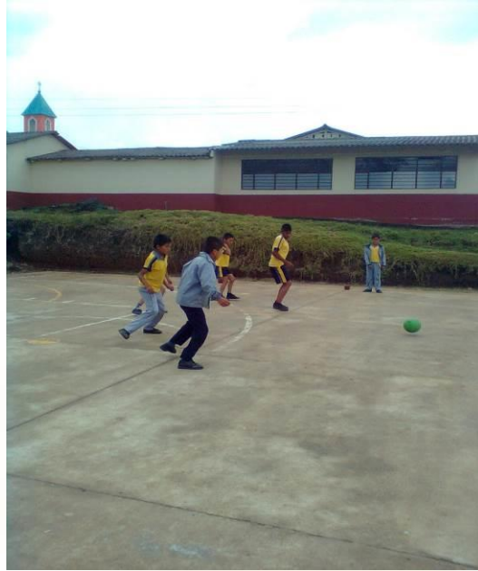
Figura 10. Jugando microfútbol haciendo pequeños equipos

“Respetan las reglas del juego, es decir, juegan al primer gol, entonces tendrá la oportunidad el siguiente equipo cuyo turno ya al inicio del juego se estableció, juegan sin peleas y con respeto”. (Observador Gd: DC)