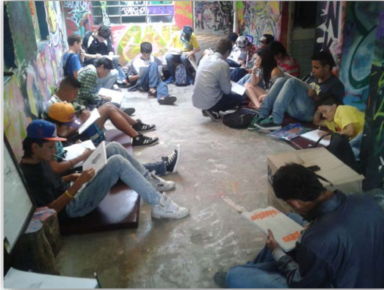
Fotografía 8. Intervención en el espacio público dentro del evento “Estilo Muerto”