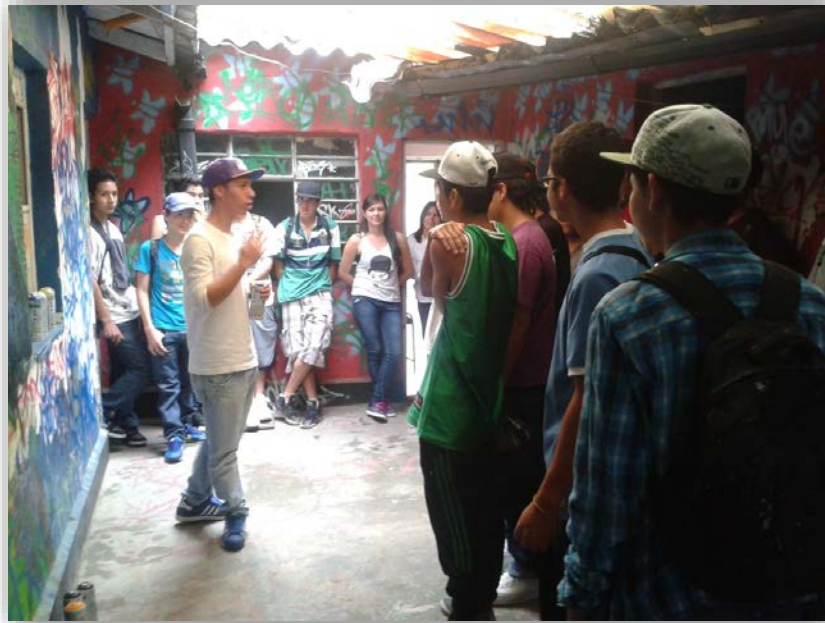
Fotografía 4. Conversación de los investigadores con los jóvenes