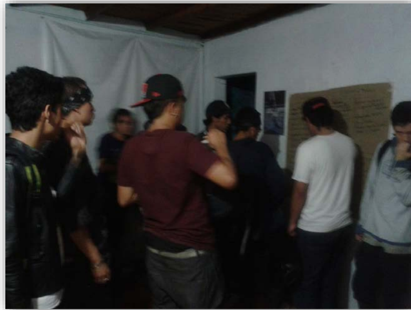
Fotografía 6. Práctica en el G-BOOBK