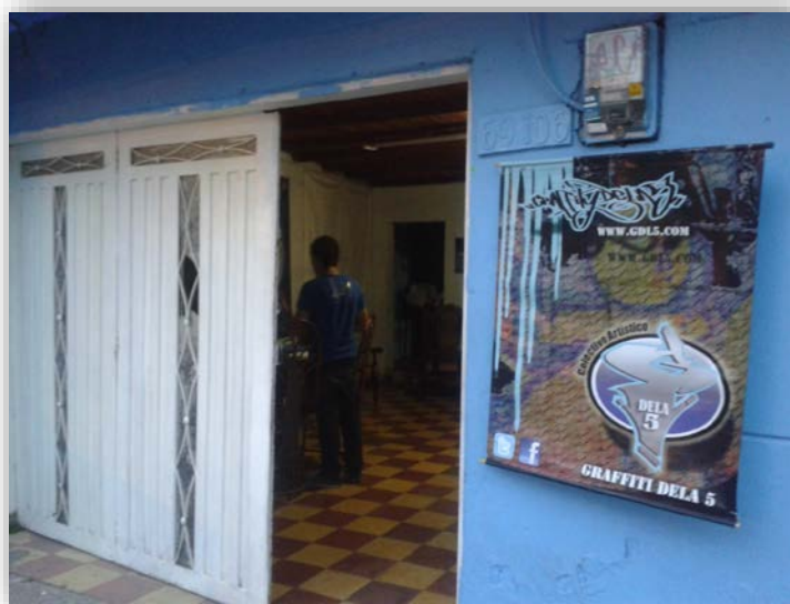
Fotografía 2. Reunión del colectivo. Inicio de la escuela de grafiti 2013