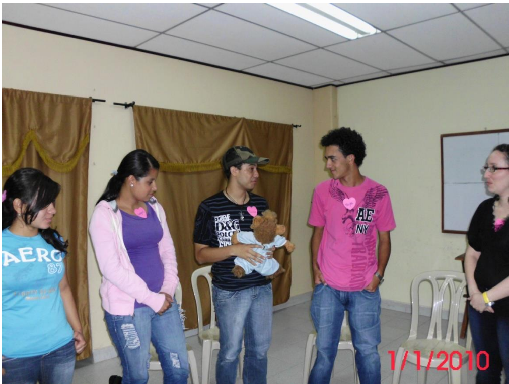
Los y las jóvenes firmando el Consentimiento Informado.