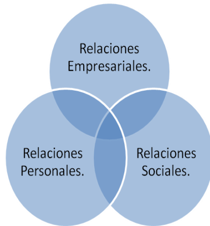
Diagrama 1. Sistema categorial de relaciones.