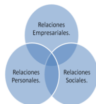
Diagrama 1. Sistema categorial de relaciones.

En la investigación se identificó a un grupo de categorías generales, que se agruparon por temas específicos, resaltando en cada uno algunos como: