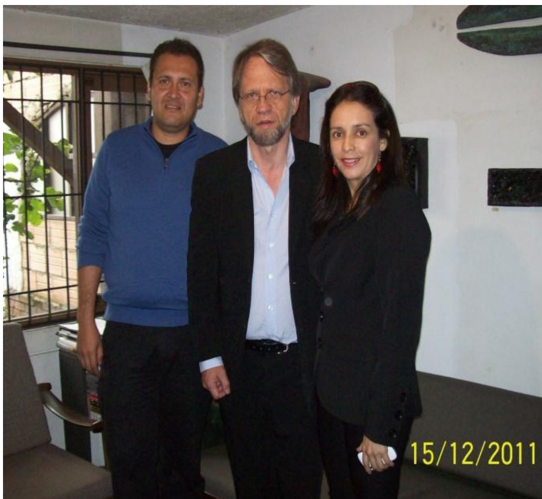
Docentes investigadores acompañados del profesor Antanas Mockus.