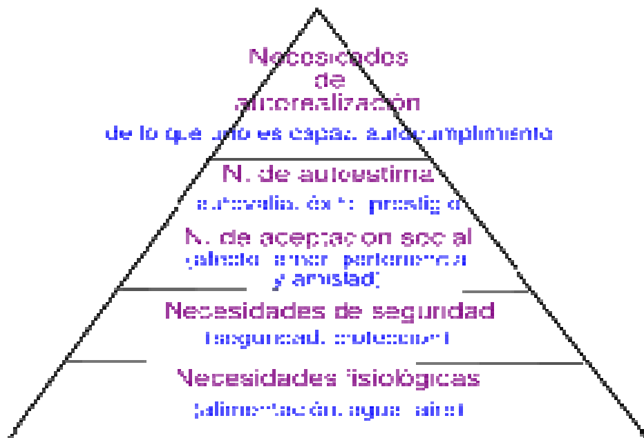
Figura 1. Pirámide de las necesidades humanas.

Necesidades fisiológicas. Son necesidades básicas para mantener la homeostasis