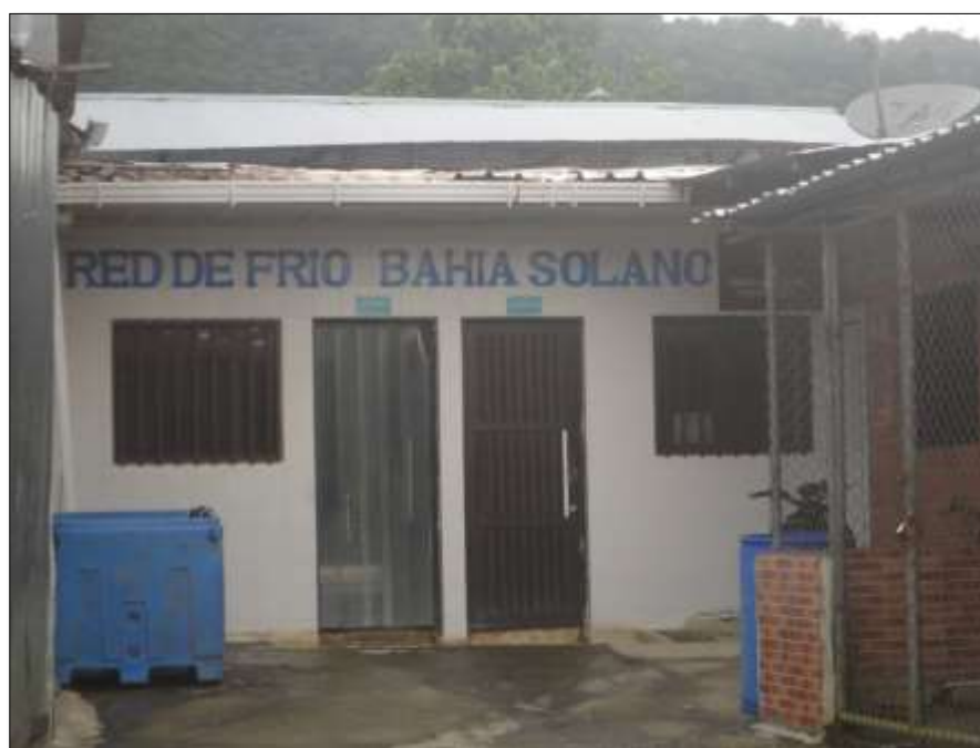
Ilustración 7. Planta de la empresa red de frío

Finalmente, es posible responder a la pregunta de ¿Cómo influyen los procesos de Educación Popular en el desarrollo de capacidades para la subjetividad política de los miembros del Grupo Interinstitucional y Comunitario de Pesca Artesanal-GICPA?, diciendo que influyen con la fragmentación y transformación de los paradigmas mentales asociados a esquemas de poder, que limitaban al pescador artesanal en el reconocimiento de las posibilidades de generar sus propias modelos de desarrollo, fomentado por el desarrollo de las capacidades individuales y grupales en un marco de aplicación de principios de gobernanza.