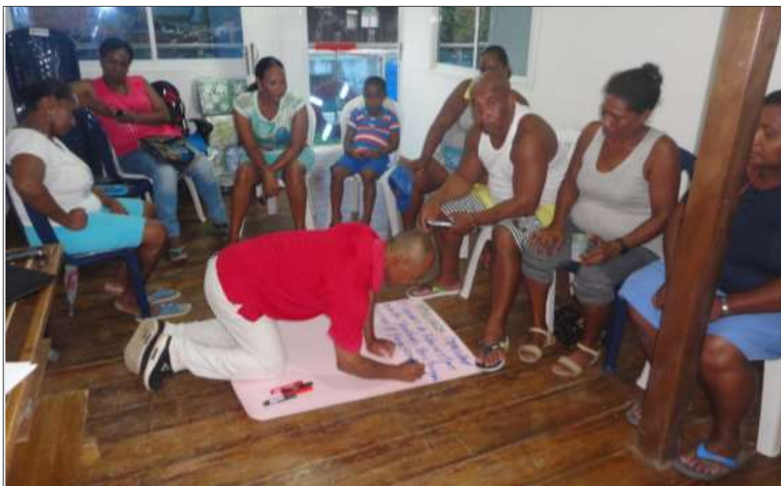
Ilustración 4. Grupo focal

Los miembros del GICPA participaron de manera positiva y compartiendo ampliamente sus recuerdos y pensamientos frente a las preguntas propuestas; generándose también reflexiones importantes que de alguna manera también sirvieron como un espacio de Educación Popular. El cuaderno de campo y la observación etnográfica se complementan permitiendo que el investigador pueda consignar información que puede ser relevante al momento de buscar las interpretaciones y la comprensión de algún dato recolectado mediante las demás herramientas; en este caso se realizaron 20 anotaciones en relación principalmente con los roles y jerarquías de los participantes en el grupo focal; también se anotaron observaciones sobre las actitudes de las personas entrevistadas al responder a las preguntas formuladas; lo que ayudo a construir las conclusiones sobre los cambios generados por el proceso educativo en el marco del GICPA; la ilustración 4. Muestra el trabajo desarrollado en el grupo focal.