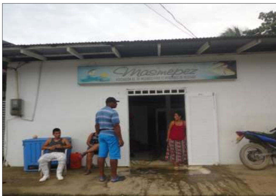
Ilustración 6. Planta de producción de hielo y cuarto frio grupo de mujeres Masmopez