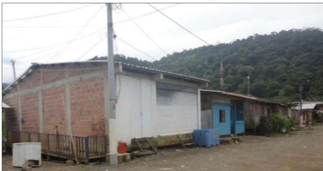
Ilustración 5. Sede de pescadores artesanales El Mana

momento y que sean importantes en la optimización del ejercicio pesquero. El desarrollo de la subjetividad política en los pescadores artesanales y mujeres procesadoras del norte chocoano agrupados en el GICPA se manifiesta o materializa en escenarios de dialogo, concertación y de participación de los niveles locales, regionales, nacionales e internacionales a los que son invitados para que expongan los avances y logros obtenidos durante su proceso organizativo; por ejemplo la red de frio que es una figura de acopio y comercialización de pescado en la que los pescadores que hacen parte de las organizaciones del GICPA comercializan sus productos de manera directa a los mercados de Bogotá y Medellín, mejorando los ingresos económicos del pescador; además de otros resultados como las áreas marinas protegidas del Pacífico norte que han sido promovidas y gestionadas por este colectivo.