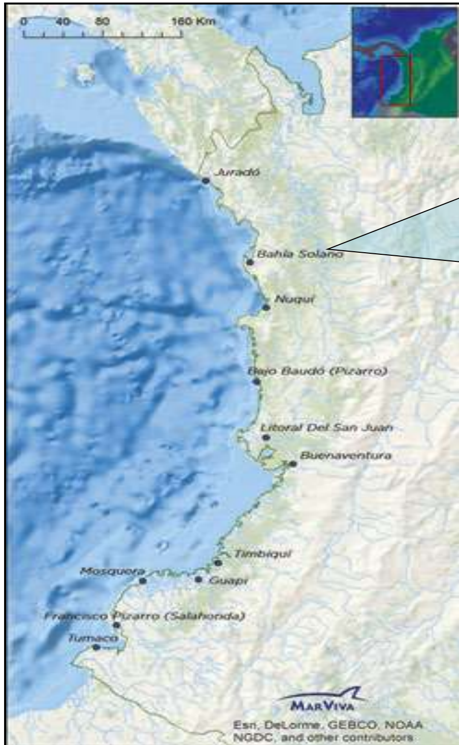
Ilustración 1. Ubicación de Bahía Solano

Bahía Solano está localizada en el occidente del Departamento del Chocó, a los 6^{\circ} 42'' de Lat. y 77^{\circ} 24'' de Long. Con una altitud de 5 metros sobre el nivel del mar, dista 178 km de Quibdó la capital del Departamento. (Mosquera, 2001, p. 13)