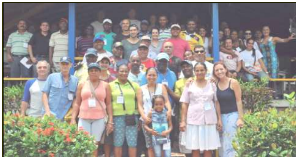
Ilustración 2. Asamblea del GICPA, marzo 2014

El grupo se constituyó por asociaciones de pescadores artesanales de los golfos de Tribugá y Cupica y del municipio de Juradó, por organizaciones de mujeres procesadoras de pescado y productoras de hielo, por el Consejo comunitario general Los delfines y Consejos comunitarios locales, el programa Plan Pacífico, el Instituto Nacional de Pesca y Acuicultura (INPA), las Unidades Municipales de asistencia técnica agropecuaria (UMATAS), la Universidad Tecnológica del Chocó (UTCH), la Asociación de tecnólogos pesqueros (ASONTEP), el Parque Nacional Natural Utría, Capitanía de Puerto, comercializadores, Fundación Eduardoño y la Fundación Natura. (Vieira, Mosquera, Palacios, Duque, Salazar y Villa, 2001, p. 57)