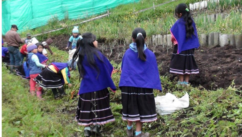
Figura 20. El parθsθtθ desde la escuela para la vida.