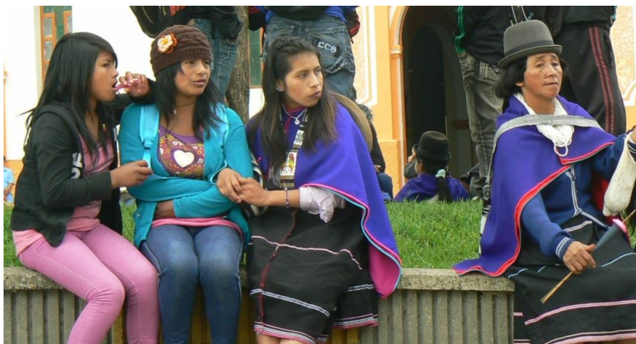
Figura 13. Adoptando modas de la cultura hegemónica.