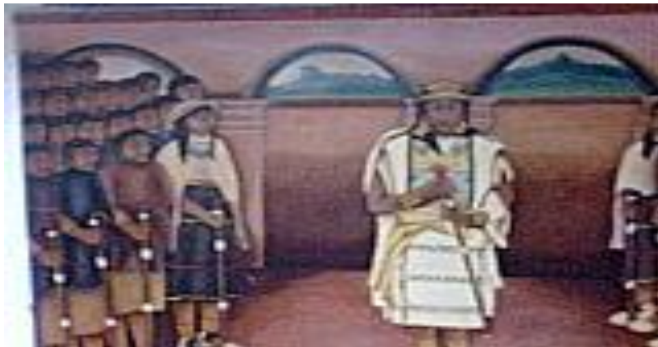
Figura 8. Pintura casa Payan.

La vida armónica y equilibrada con el cosmos, es lo que hace que el ser Misak tenga poder y soberanía para ejercer la libertad de acción con la naturaleza y los demás seres que lo rodean. La naturaleza da todo para ser soberanos, en lo personal y comunitario. El buen manejo de la esencia del ser, es lo que hace que el ser Misak, tenga una posición importante sobre las demás seres de la naturaleza. Historiadores, antropólogos como Cieza de Leon, y la tradición oral de los mayores del pueblo Misak coinciden en que el territorio donde habitaban los Guambianos era amplio y permitía tener una organización por confederaciones lideradas por caciques, los principales, el cacique, Puben, Payan y Yazguen. Con la llegada de los españoles el territorio se fue haciendo más pequeño, así lo afirma el taita Gerardo Tunubala: “Nuestro territorio va a sufrir tres o cuatro grandes etapas de achicamientos en primer lugar va a estar la confederación llega la conquista española y sufre el primer y o hablo des resquebrajamiento territorial a través de los pueblos de indios segunda la tercera va a sufrir con las conformación de las famosas encomiendas y las cuarta la última es la conformación de los Resguardos”