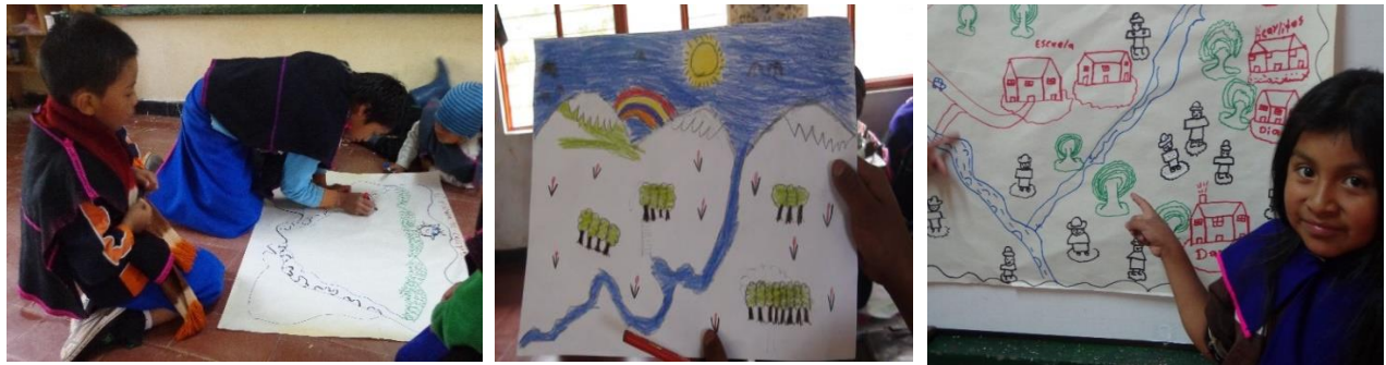
Figura 7. Ejercicio: percepciones del territorio de los niños Misak.

El mosaico de la figura 7, evidencia el trabajo desarrollado con niños Misak, sobre la percepción que éstos tienen sobre sus sitios sagrados y representativos.