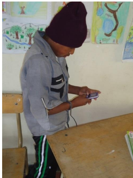
Figura 16. Joven adepto a la tecnología y modas de la cultura hegemónica.