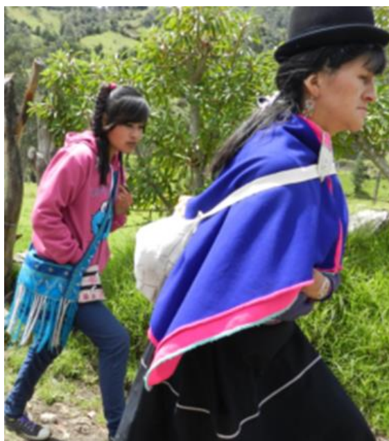
Figura 15. Joven Emo Misak, rompiendo la tradición de los mayores.

de la televisión ahora como cada familia cuenta con eso, los niños, la joven o el joven cree más a esas imágenes de esa pantalla chica que al papa o la mama, entonces los medios de comunicación son uno de los elementos que más nos perjudican en los últimos años, por eso a pesar que hemos resistido tanto con esa mal llamada conquista, colonia que para nosotros fue ese proceso de invasión, ahora ultimo con la invasión de las tecnologías de información y comunicación nos está acabando con más rapidez, ya que las nuevas generaciones no quieren hablar la lengua propia pesar de que lo enseñan sus familiares y en los espacios escolares, ya no quieren vestir como los Misak, con ese cambio, de dejar de hablar, de dejar de vestir ya cambian sus actitudes, sus valores, ya no piensan como Misak, ya quieren pensar como otra gente”.