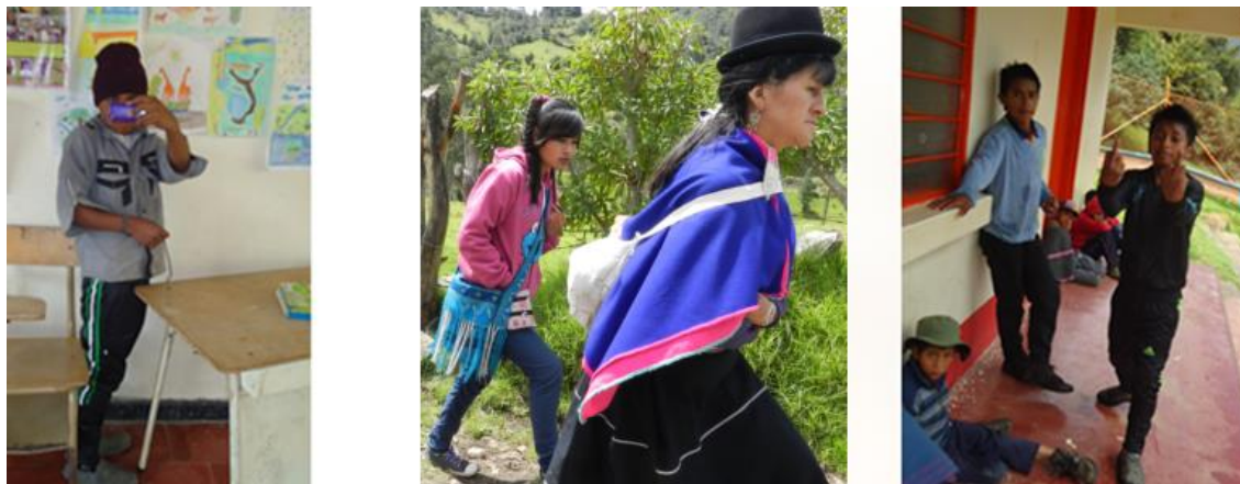
Figura 3. Imitando culturas urbanas.

El avance histórico de los diferentes pueblos del mundo, la llegada del capitalismo, los medios masivos de comunicación, la globalización del mercado, de la cultura, en la actualidad está golpeando la cultura guambiana. Es así como hoy encontramos algunos jóvenes queriendo imitar las culturas urbanas, dejando atrás muchos de los aspectos que caracterizan la identidad y cultura del pueblo Misak.