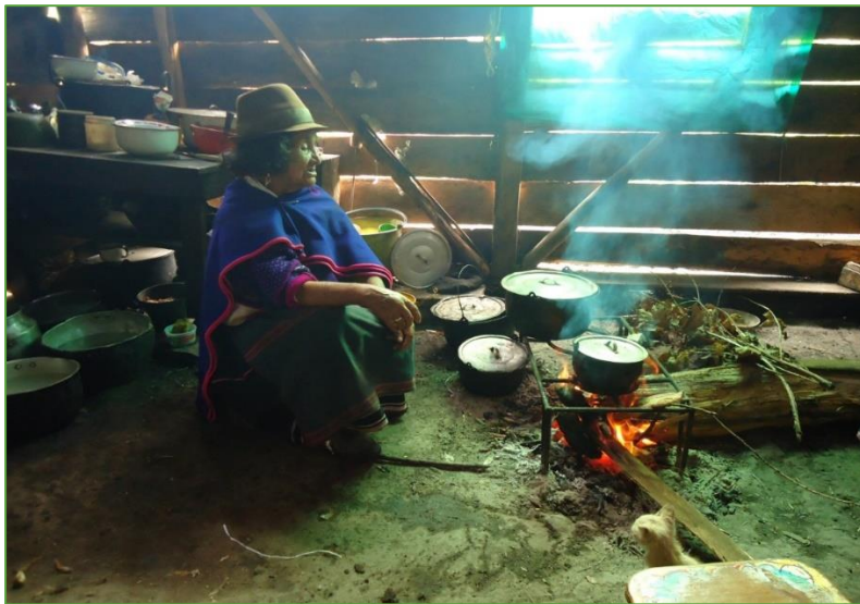
Figura 11. El Nak Chak, sitio donde se recrea la cultura Misak.

Palabra ancestral que significa cocina, espacio donde la familia es el centro, donde se crea y se recrea la cultura. La cocina como espacio donde se enseña las costumbres, los diferentes conocimientos; si tradujéramos literalmente Nak, significa fuego, candela, chak: espacio plano; el nak chak, siempre se encontraba ubicado en el centro de la cocina, el cual convocaba a todos los miembros de la familia en los momentos de consumir los alimentos, especialmente en las tardes después de la cena se dialogaba, se aconsejaba y se trasmitían saberes ancestrales.