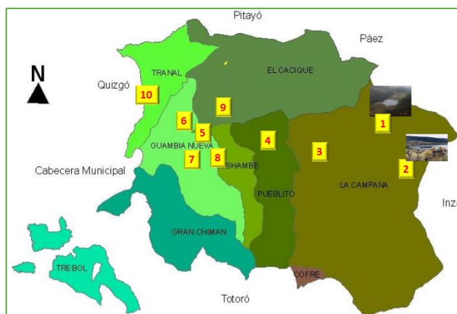
Figura 6. Cartografía semiótica del territorio Misak