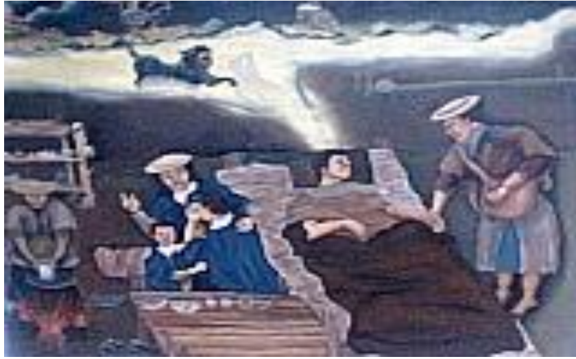
Figura 12. Pintura casa Payan, representa la espiritualidad Misak.