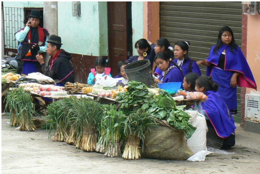
Figura 19. Día de mercado en Silvia.