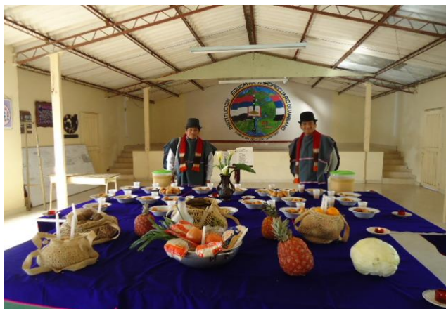
Figura 10. Alimentación y comidas propias Misak.