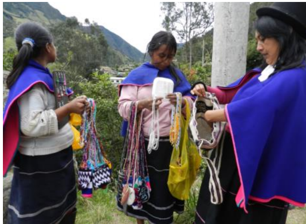
Figura 2. Representando la cosmovisión en el tejido.