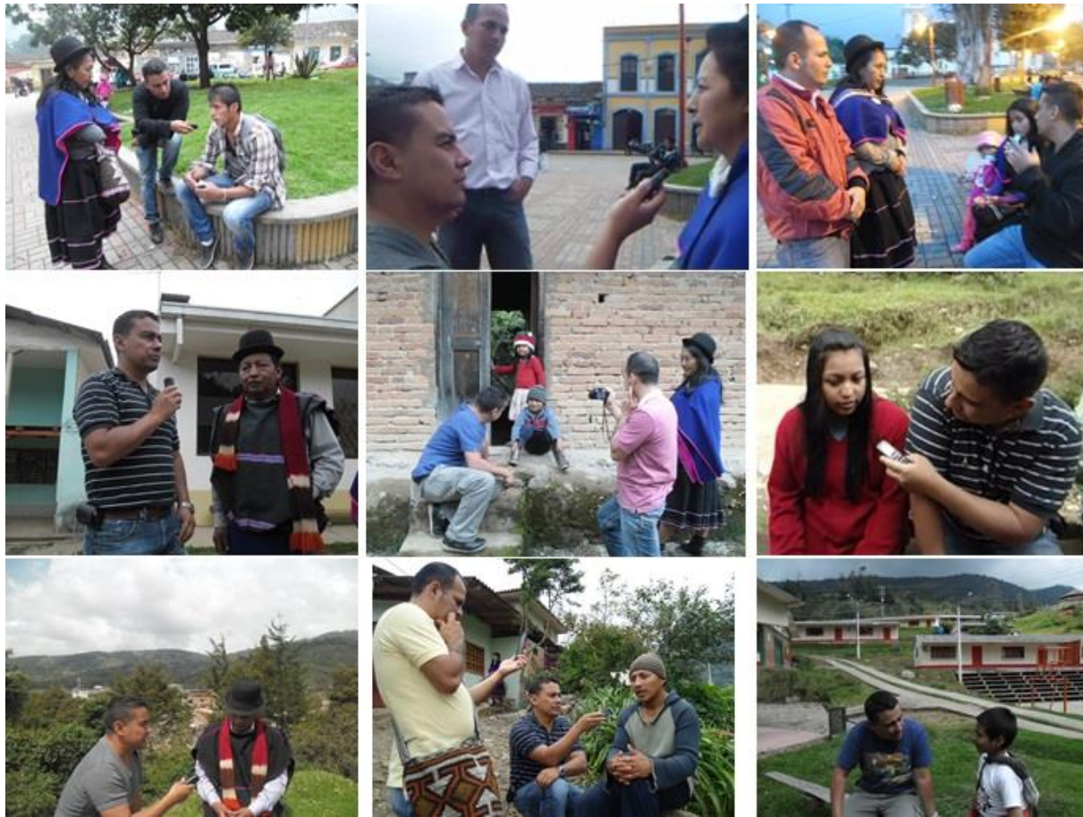
Figura 5. Entrevistas realizadas en el resguardo de guambia.