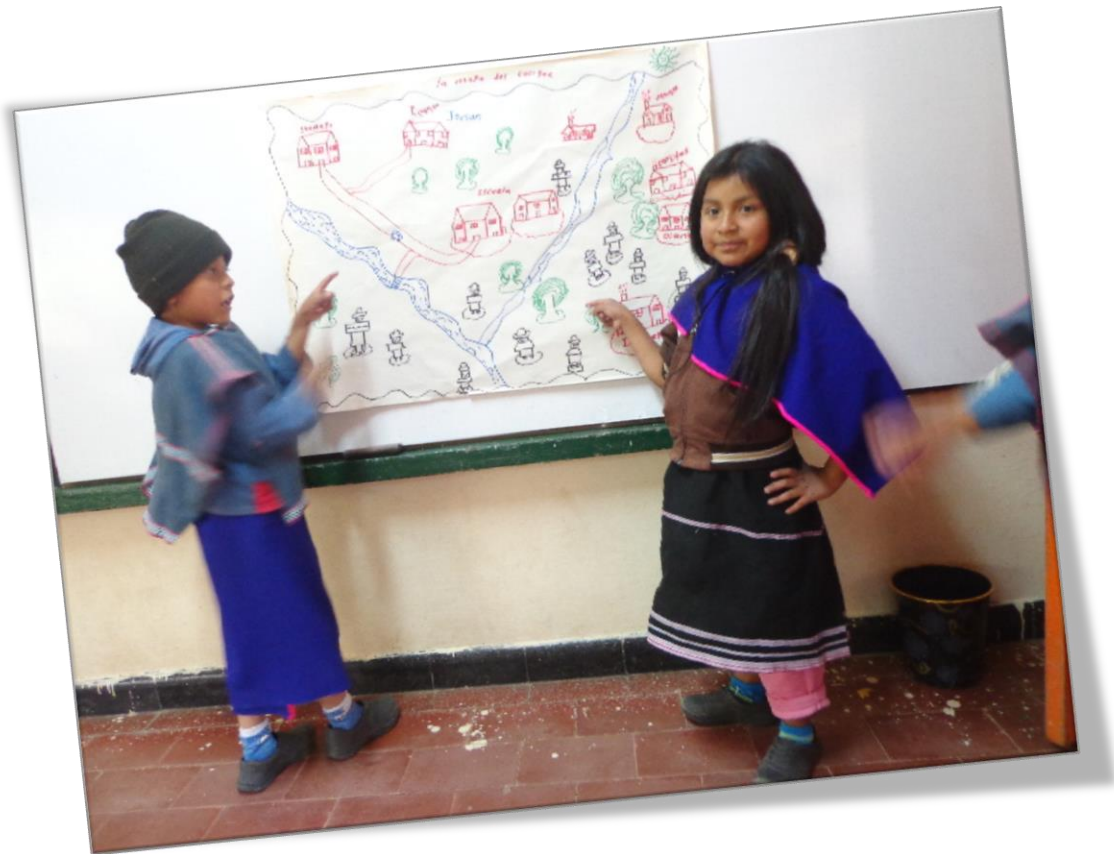
Percepciones del territorio de los niños Misak. 9