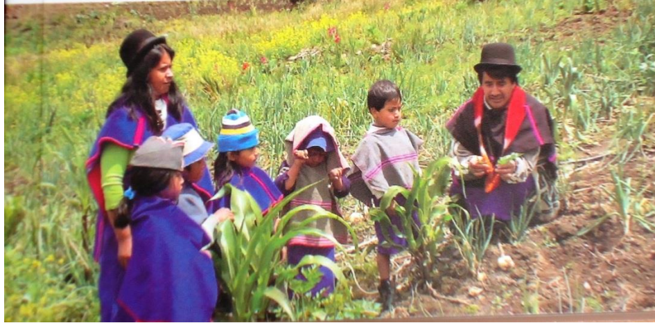
Figura 17. Sembrando y aprendiendo en el Ya Tull.