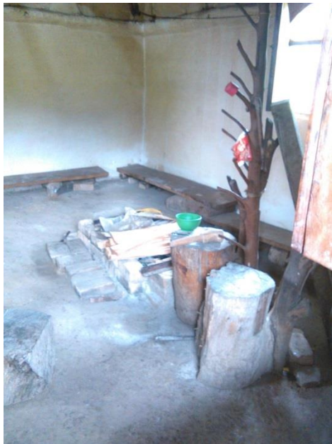
Figura 14. El Nak ChaK, donde se recrea el conocimiento.

entonces nosotros permanecíamos con mi papa mi mama mis hermanos todos ahí reunidos en el fogón, entonces ahí siempre está más fuerte la unión familiar, pero en cambio cuando uno ya no tiene, cuando llega la tecnología entonces ya está el televisor, ya está los equipos todo eso ya los niños ya los jóvenes van y entonces, el fogón poca importancia, a la familia poca importancia y entonces eso también ha debilitado mucho a la comunidad y eso también ha ayudado un poquito a perder pues algo de nuestra cultura; claro que pues también lo positivo, pues dependiendo como uno lo maneje también puede que fortalezca la comunidad dependiendo del uso”.