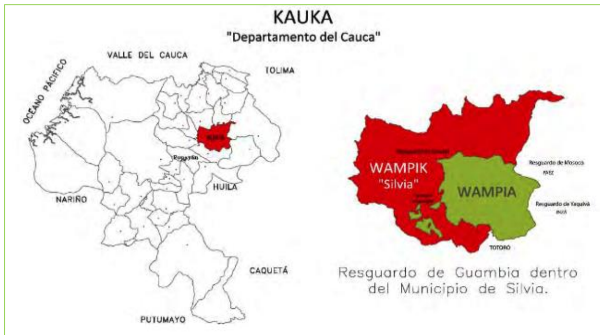
Figura 1. Ubicación del resguardo de Guambia

EL Resguardo de Guambia se encuentra ubicado en el municipio de Silvia, al nororiente del Departamento del Cauca, en el suroccidente colombiano, en las estribaciones de la Cordillera Central, con una extensión territorial de 18.242 hectáreas, limitado por los Resguardos indígenas de Totoro, Inza, Pitayo, Quizgo y Quichaya.