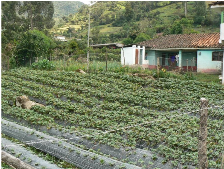
Figura 18. Reemplazando el Nak Chak por el monocultivo.

El Ya tul gradualmente ha perdido su importancia en la comunidad, debido a la influencia capitalista que reemplaza las formas ancestrales y diversas de cultivos de pan coger y plantas medicinales en la huerta Misak por el monocultivo que requiere adquisición de semillas, abonos químicos y agrotóxicos que generan dependencia del producto y a su vez son foco de múltiples enfermedades entre las personas quienes están expuestos a estos pesticidas y fertilizantes.